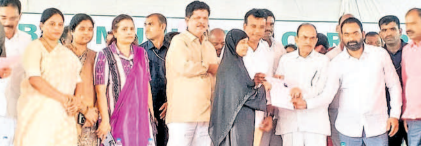
అభిదారులకు పత్రాలు అందిస్తున్న మంత్రి, ఎమ్మెల్యేలు, ఎమ్మెల్సీ