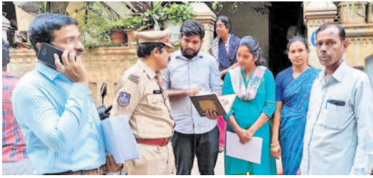
యానుభవగూడలో ఓటర్లతో మాట్లాడుతున్న అధికారులు