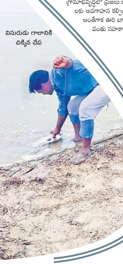
విసురుడు గాలానికీ చిక్కిన చేప