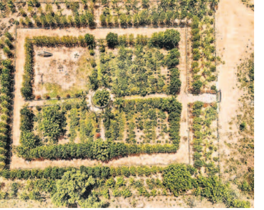
బొమ్మాపల్లె పల్లె ప్రకృతి వనంలో నాణిన మొక్కలు