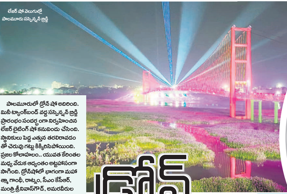
లేజర్ షా వెలుగుల్లో పాలమూరు సస్పెన్షన్ బ్రిడ్జి