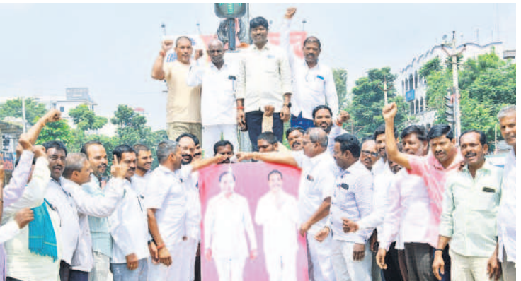
సీఎం కేసీఆర్ చిత్రపటానికి క్షీరాభిషేకం చేస్తున్న రేషన్ డీలర్లు, బీఆర్ఎస్ నాయకులు

కామారెడ్డి, అక్టోబర్ 2 : రేషన్ డీలర్లకు ప్రభుత్వం రెండింతలు కమీషన్ పెంచుతూ జీవో జారీ చేయడంపై హర్షాతిరేకాలు వ్యక్తమవుతున్నాయి. ఈ మేరకు కామారెడ్డి జిల్లా కేంద్రంలోని నిజాంసాగర్ చౌరస్తా వద్ద రేషన్ డీలర్లు సోమవారం సీఎం కేసీఆర్ చిత్రపటానికి క్షీరాభిషేకం చేశారు. ఈ సందర్భంగా వారు మాట్లాడుతూ.. క్వింటాలుకు గతంలో రూ.70 ఉండగా.. ఏకంగా రెండింతలు పెంచుతూ రూ.140 ప్రకటించినది