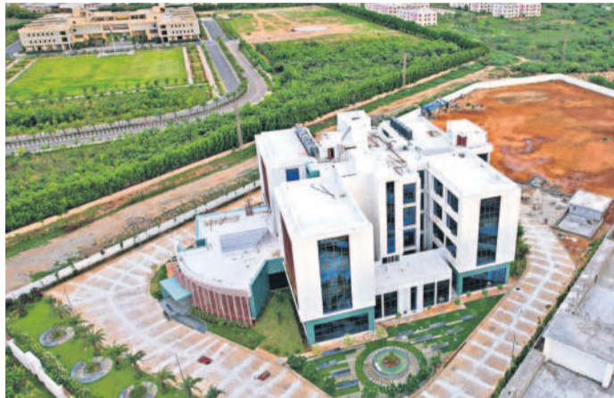
నిజామాబాద్ కలెక్టరేట్ వకన అధ్యుతంగా నిర్మించిన ఐటీ హాట్

కనులారా వీక్షించండి ప్రధాని మోదీ మంగళవారం ఆకాశమూర్తిగా నిజామాబాద్ పర్యటనకు వస్తున్నారు. ఎన్నో అభివృద్ధుల వివరాలను మోదీకి సువిశాల ప్రాంగణం వరకు కేసీఆర్ చేసిన అభివృద్ధి సాక్షాత్కారం చూస్తున్నది. సమీకృత కలెక్టరేట్, ఐటీ టవర్, న్యూక్ బిల్డింగ్, మందారమాలా రూపుదిద్దుకున్న బైపాస్ రోడ్డు, రూ.4 కోట్లతో నిర్మింపబడిన ఆధునిక వైకుంఠదామం వంటి పన్నీ మోదీ వస్తున్న ప్రాంతానికి కేవలం 100 చదరపు మీటర్ల పరిధిలోనే ఉన్నాయి. ప్రధాని అభివృద్ధిని గుర్తుచేశారు. భూమి 2018లోనే భూమిని కేటాయింది. కేంద్రానికి లెబలు పంపామని తెలిపారు.