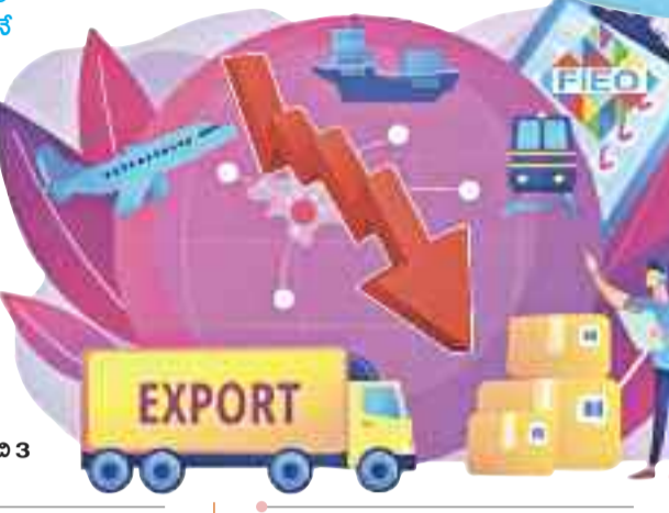
ఈ ఏడాది ఏప్రిల్-ఆగస్టు మధ్య దేశ ఎగుమతులు గతంతో చూస్తే 11.9 శాతం వరకు 172.95 బిలియన్ డాలర్లకు పరిమితం చేయాలి. జూలైలో ఏకంగా 15.88 శాతం క్షీణత కనిపించింది.

కార్మిక శక్తి ఎక్కువగా ఉన్న రంగాలపై ప్రభుత్వ దృష్టి లేకపోతే.. దేశంలో నిరుద్యోగ సమస్యకు దారితీస్తుంది. యావత్ దేశ ఆర్థిక వ్యవస్థనే ఇది ప్రభావితం చేయగలదు.