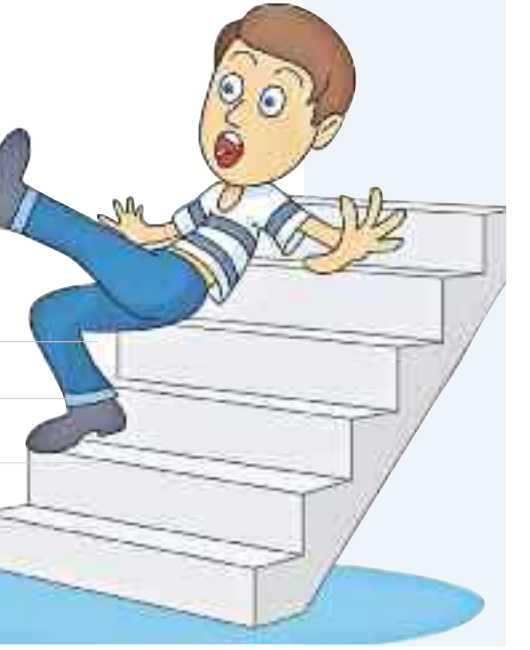
బెషర రంగంలో ఆశించిన స్థాయిలో వృద్ధి కనిపిస్తున్నా.. నాణ్యతా లోపాలు ప్రమాద ఘంటికల్ని మోగిస్తున్నాయి. దగ్గు ముందు విషయంలో అంతర్జాతీయ మార్కెట్లో భారత ప్రతిష్ట దెబ్బ తిన్నది.

నెట్ హై-వాల్యూ ఆడిషన్లో ఈ కంపెనీల వాటా కూడా ఎక్కువేనని, అయినప్పటికీ 1 నుంచి 2 శాతం వృద్ధికే పరిమితమవుతున్నాయని ఎఫ్ఐఈఎఫ్ ఓ. తాజా నివేదికలో తెలిపింది. నిజానికి వివిధ దేశాల్లో ఇదే రంగాల వృద్ధిరేటు ఆకర్షణీయంగా ఉందని గుర్తుచేస్తుండటం గమనీయం. అంతేకాదు గుర్తుచేస్తున్నది. ఈ క్రమంలోనే ఉత్పాదక వ్యయం వాణిజ్యం 8 శాతంగా ఉంటే, భారత వృద్ధి రేటు 2 శాతమేనవుతుంది.