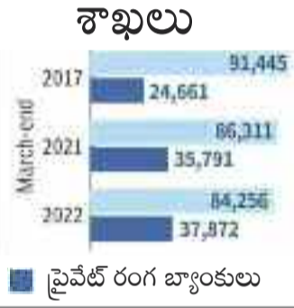
■ ప్రభుత్వ రంగ బ్యాంకులు ■ ప్రైవేట్ రంగ బ్యాంకులు