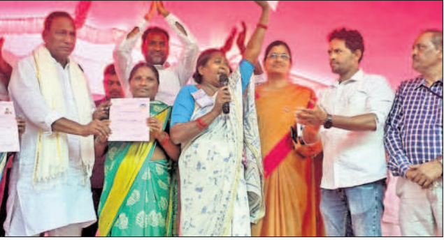
అభిదారులకు డబుల్ బెడ్రూం ఇండ్ల పట్టాలను అందజేస్తున్న మంత్రి మల్లారెడ్డి

అహ్మద్ గూడలో డబుల్ బెడ్రూం ఇండ్ల పంపిణీలో కార్మికశాఖ మంత్రి చామకూర మల్లారెడ్డి