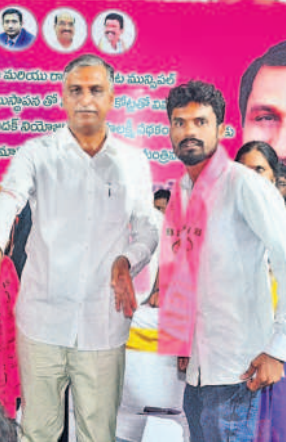
బీఆర్ఎస్ లో చేరిన యువకులు