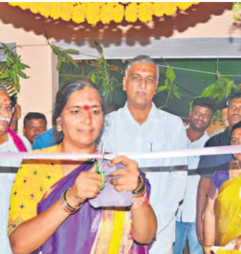
ఆర్థిక కార్యాలయాన్ని ప్రారంభిస్తున్న ఎమ్మెల్యే పద్మాదేవేందర్ రెడ్డి, మంత్రి