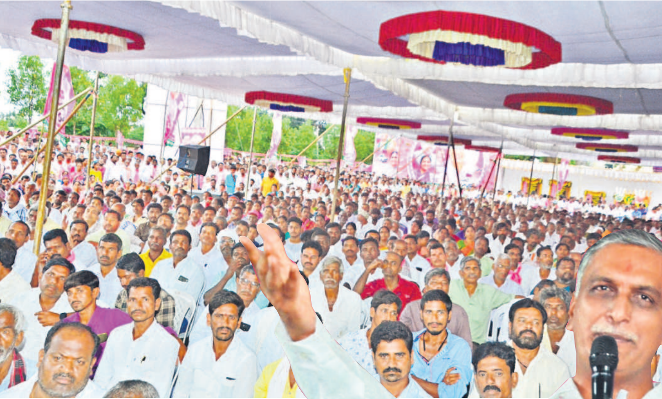
రామాయంపేట సభకు హాజరైన బీఆర్ఎస్ కార్యకర్తలు, ప్రజలు