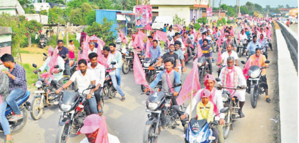
రామాయంపేటలో బీఆర్ఎస్ నాయకులతో బైక్ ర్యాలీగా వస్తున్న మంత్రి