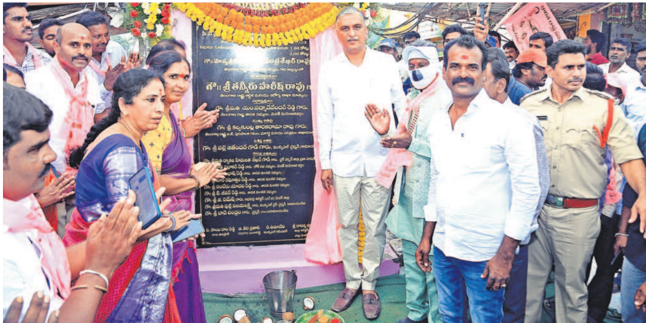
సోమవారం రామాయంపేట పట్టణంలో సీసీ రోడ్డు, డ్రైనేజీ పనులకు శంకుస్థాపన చేస్తున్న మంత్రి హాజీరావు, ఎమ్మెల్యే పద్మాదేవేందర్ రెడ్డి తదితరులు