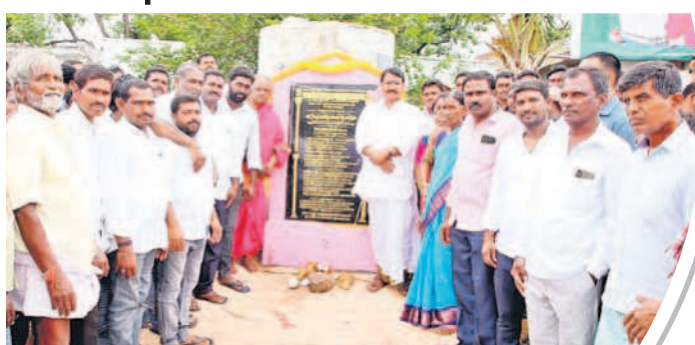
అభివృద్ధి పనులకు శంకుస్థాపన చేస్తున్న మంత్రి నిరంజన్ రెడ్డి

సమైక్య పాలనలో కునారిల్లని కులవృత్తులను ప్రోత్సహించి ఆర్థిక స్థిరత్వం కల్పించేందుకు ప్రభుత్వం చర్యలు చేపట్టింది. ఇందులో భాగంగా గొల్లకురు మలను ఆడుకునేందుకు 75 శాతం సబ్సిడీపై గొర్రెపిల్లలను పంపిణీ చేస్తున్నది. ఇప్పటికే మొదటి విడుత పంపిణీ విజయవంతం కాగా.. గొల్లకురు మల కుటుంబాల్లో ఆర్థిక స్థిరత్వం వచ్చింది. దీంతో మళ్లీ పంపిణీకి సీఎం కేసీఆర్ నిర్ణయించారు. జోగుళాంబ గద్వాల జిల్లాలో ఇప్పటికే రెండో విడుత పంపిణీ ప్రారంభమైంది. జిల్లా వ్యాప్తంగా 8,833 యూనిట్ల అందజేతకు పశుసంవర్ధక శాఖ అధికారులు కనరత్న మొదలుపెట్టారు. దీంతో కాపరుల మోములో చిరుదరహాసం నెలకొన్నది. - గద్వాల, అక్టోబర్ 2