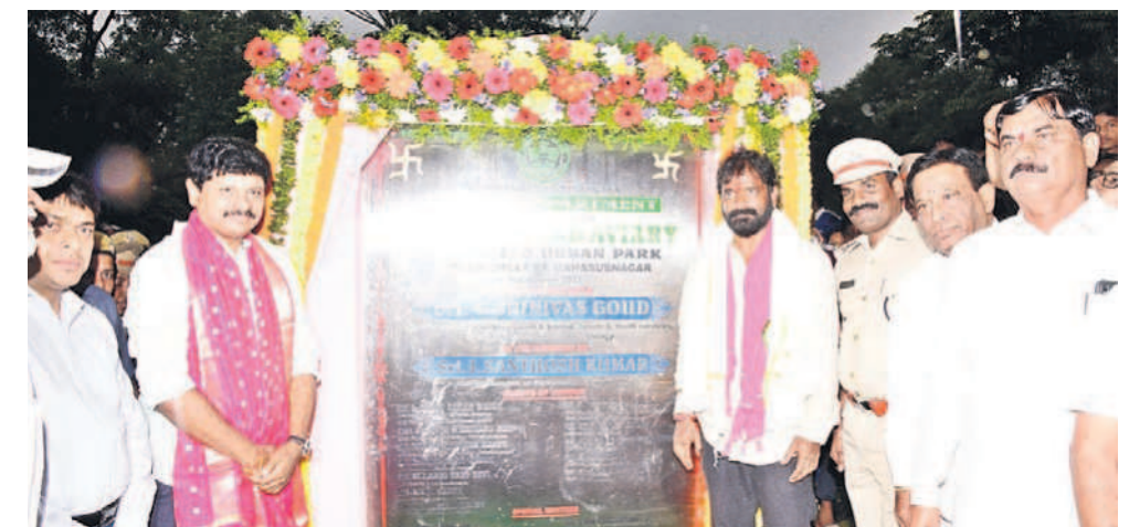
బర్డ్స్ ఎన్ క్లవ్ నిర్మాణానికి శంకుస్థాపన చేస్తున్న మంత్రి శ్రీనివాస్ గౌడ్, ఎంపీ సంతోష్ కుమార్

మహబూబ్ నగర్ మెట్టగడ్డ, అక్టోబర్ 2 : కేసీఆర్ ఎకో అర్బన్ పార్కును ప్రపంచంలోనే అత్యుత్తమమైనదిగా తీర్చిదిద్దేందుకు మంత్రి శ్రీనివాస్ గౌడ్ ఆహ్వానాలు కృషి చేస్తున్నారు. అందుకు పూర్తి సహకారం అందిస్తామని ఎంపీ జోగి నవలలి సంతోష్ కుమార్ అన్నారు. మహబూబ్ నగర్ లోని కేసీఆర్ ఎకో అర్బన్ పార్కులో రూ.2.70కోట్లతో నిర్మించనున్న బర్డ్స్ ఎన్ క్లవ్ లోను ఎంపీ, మంత్రితో కలిసి సోమవారం ప్రారంభించారు. అనంతరం 28వేల ఎకరాల్లో దేశంలోనే అతిపెద్ద జంగిల్ సఫారీతోపాటు రెండు సఫారీ వానానాలను ఐండా ఊపి ప్రారంభించి ఆ వానానాలోనే వానీటవర్ వరకు వెళ్లి అటవీ ప్రాంతాన్ని తిలకించారు. అనంతరం అక్కడ నిర్వహించిన విలేజరుల సమావేశంలో మంత్రి శ్రీనివాస్ గౌడ్ మాట్లాడారు. గ్రీన్ ఇండియా చాంపియన్ డ్యారా పచ్చదనాన్ని పెంచి పర్యావరణాన్ని కాపాడుతున్న ప్రకృతి ప్రేమి కుడు ఎంపీ సంతోష్ చేతుల మీదుగా జంగిల్ సఫారీని ప్రారంభించుకోవడం సంతోషంగా ఉందన్నారు. పదేండ్ల సీఎం కేసీఆర్ పాలనలో తెలంగాణ అద్భుత ప్రగతి సాధించిందన్నారు. తాగు, సాగునీరు, మెడికల్, ఇంజనీరింగ్ కళాశాలలు, ఇటీవల ఇలా ఎన్నో ఏర్పాటు చేసుకున్నామని తెలిపారు.