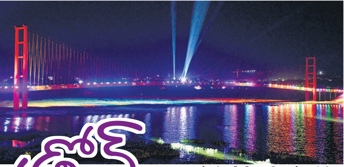
పాలమూరులో వి.మి.ట్యాంక్ బండ్ వద్ద విద్యుత్ కాంతిలో సస్పెన్షన్ లైట్స్