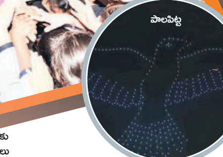
డ్రోన్ షోస్ను తిలకించడానికి వచ్చిన ప్రజలు