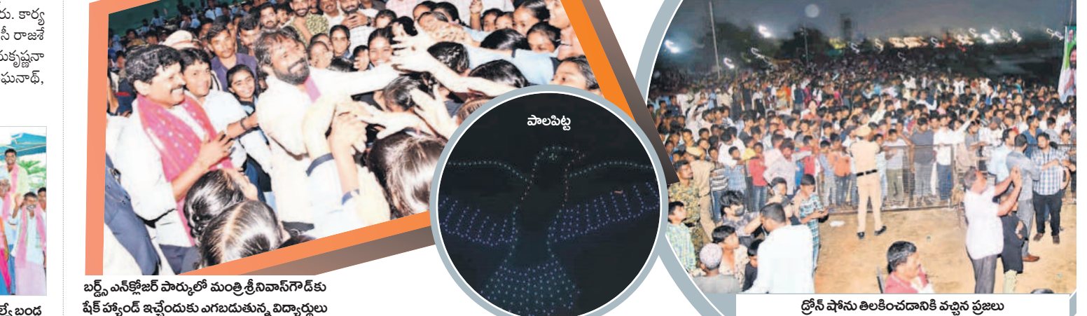
బర్డ్స్ ఎన్ క్లవ్ పార్కులో మంత్రి శ్రీనివాస్ గౌడ్ కు షేక్ హ్యాండ్ ఇచ్చేందుకు ఎగబడుతున్న విద్యార్థులు