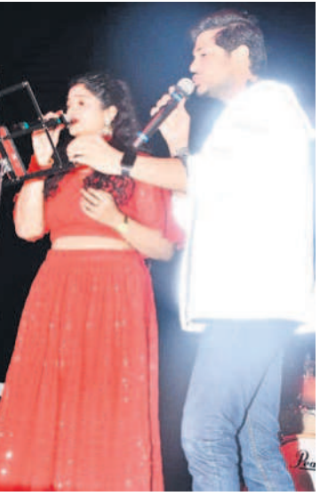
పాటలతో ఉర్రూతలూగిస్తున్న గాయకులు