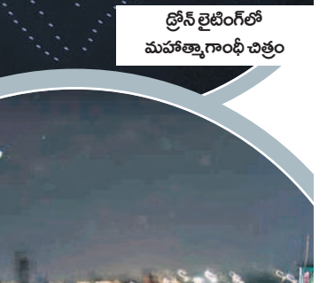
డ్రోన్ లైటింగ్లో మహిళా గాంధీ చిత్రం