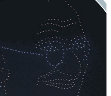
డ్రోన్ లైటింగ్లో సీఎం కేసీఆర్ చిత్రం