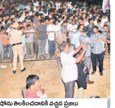
డ్రోన్ షోస్ను తిలకించడానికి వచ్చిన ప్రజలు