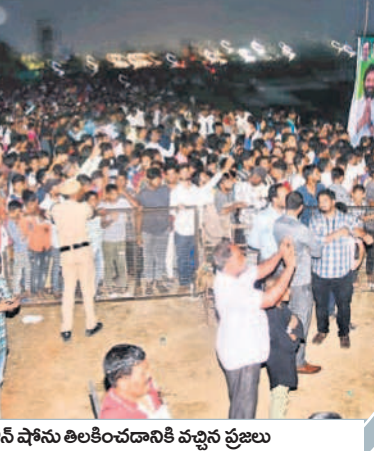
డ్రోన్ షోస్ ను అలకించడానికి వచ్చిన ప్రజలు