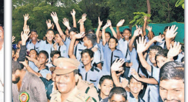
ఎకో అర్బన్ పార్కులో సందర్శించేస్తున్న విద్యార్థులు