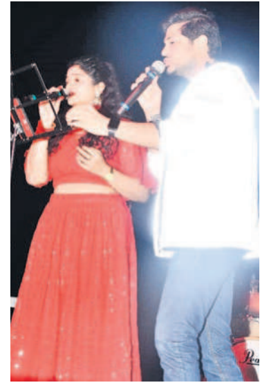
పాటలతో ఉర్రూతలూగిస్తున్న గాయకులు