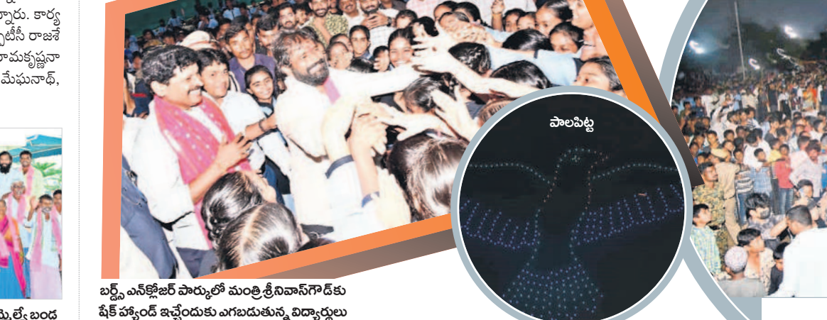
బర్న్స్ ఎన్ క్లౌజర్ పార్కులో మంత్రి శ్రీనివాస్ గౌడ్ కు షో షోస్ ఇచ్చేందుకు ఎగబడుతున్న విద్యార్థులు