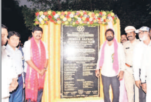
సఫారీ టూరిస్టుల ప్రారంభాన్ని మంత్రి, ఎంపీ