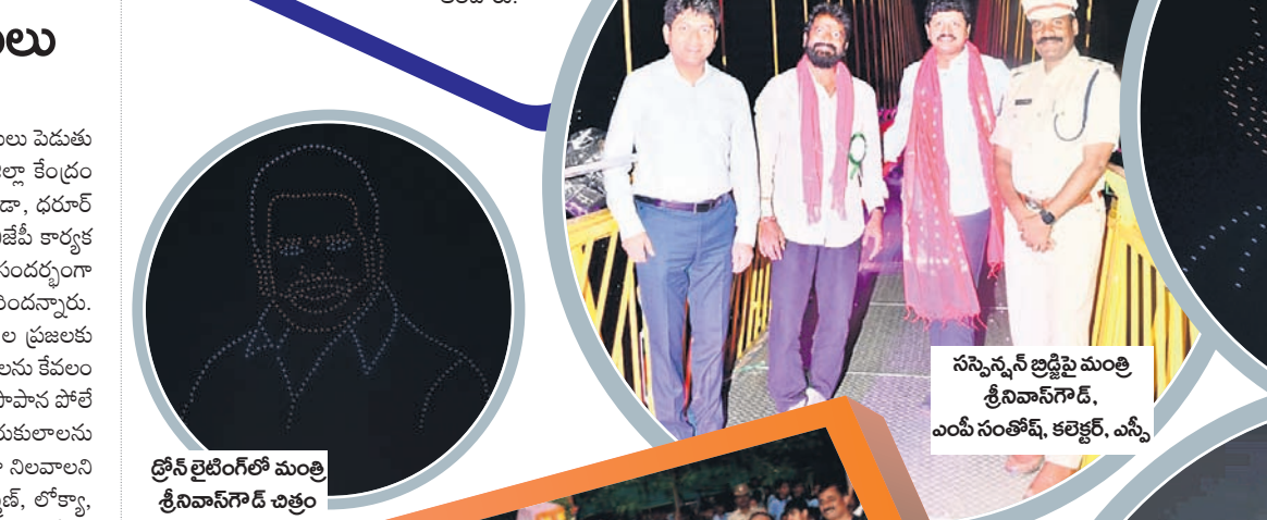
సస్పెన్షన్ లిఫ్ట్ మంత్రి శ్రీనివాస్ గౌడ్, ఎంపీ సంతోష్, కలెక్టర్, ఎస్సీ