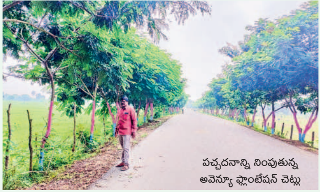
వచ్చినాన్ని నింపుతున్న అవెన్యూ ప్లాంటేషన్ చెట్లు

విశాలమైన రోడ్లు, వచ్చిన చెట్లు గ్రామంలో ప్రభుత్వ నిధులతో ప్రజల సౌకర్యం కోసం విశాలమైన సీసీ రోడ్లు, డ్రైనేజీలు నిర్మించారు. నాడు ఇరుకైన రోడ్లతో ఇబ్బంది పడ్డ ప్రజలు నేడు విశాలమైన రోడ్లతో సంతోషం వ్యక్తం చేస్తున్నారు.