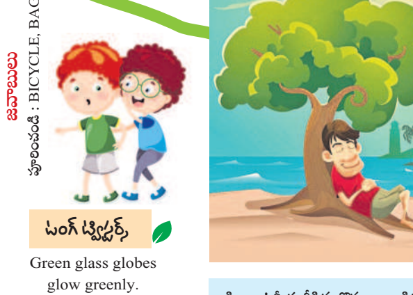
జ్జూలులు ఫూలంబడి : BICYCLE, BAG

తెల్లవారి అలస్యంగా నిద్రలేచాడు హరి. ఉద్యోగానికి వెళ్లాలని భార్య తొందరపెట్టింది. హరి ఏమాత్రం పట్టించుకోలేదు. 'ఇప్పుడే ఎందుకు తొందర? ధనాగారం తెరవడానికి చాలా సమయం పడుతుంది. నేను బోజునం చేసి వెళ్తా! ముందైతే నాకు అన్నం పెట్టు!' అన్నాడు. కడుపునిండా తిని, ఇంట్లోనే ఓ గంటసేపు విశ్రాంతి తీసుకున్నాడు. తర్వాత నమ్మ దిగా లేచేసరికి మధ్యాహ్నం అయింది. ఆదరాబాదంగా రాజ భవనానికి బయల్దేరాడు. అది ఎండకాలం. దాంతో నడక వల్ల తీవ్రంగా అలసిపోయి.. మార్గమధ్యలో చెట్టు కింద ఆగి విశ్రాంతి తీసుకున్నాడు. అలసిపోయి ఉండటంతో.. వెంటనే కన్ను అంటుకుంది. నిద్ర లేచేసరికి పొద్దు వాయితున్నట్లు గుర్తించాడు. హడావుడిగా లేచి.. మళ్లీ నడక మొదలుపెట్టాడు. తాను రాజభవనానికి చేరుకునే సరికి.. చీకటి పడే వేళ అయింది. అప్పటికి ధనాగారంలో పనిచేసేవారికూ వెళ్లిపోయాడు. హరి కూడా గిరి కోసం ఎదురు చూసేవాసీ, ధనా గారానికి తాళం వేసి వెళ్లిపోయాడు. గిరి వచ్చేసరికి మూసీ ఉన్న ధనాగారం తలుపుల దగ్గర భటులు కావలి కాస్తూ కనిపించారు. దాంతో చేసేది లేక నిశ్చిన్.. ఇంటి దారిపట్టాడు. తన సోమరితనం వల్లే ఈ పరిస్థితి దాదాంబించిందని బాధ పడ్డాడు. సమయం విలువైందని గ్రహించడంకా దొన్న ఇచ్చిన అవకాశాన్ని కోల్పోయాడు.