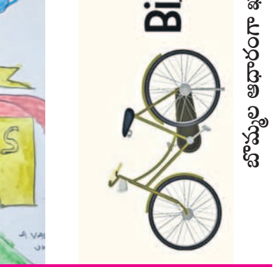
బొమ్మల ఆధారంగా ఖాళీలను పూరించండి

పిల్లలూ! మీరు గీసిన బొమ్మలు, రాసిన కథలు మాకు పంపండి. బాగుంటే ప్రచురిస్తాం. మా చిరునామా: zindagi@ntnews.com