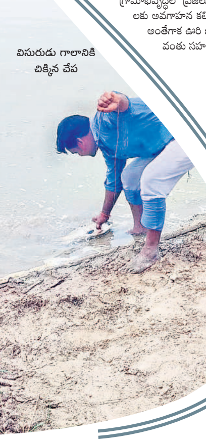
విసురుడు గాలానికీ చిక్కిన చేప