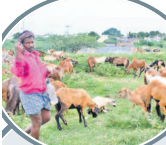
పేదోళ్లకు ఎంతో మేలు..

10లక్షల అందజేస్తున్నది. అదేవిధంగా బీసీ, మైనార్టీలకు ప్రత్యేకంగా లబ్ధిదారులకు ఎలాంటి ప్రాధాన్యత లేకుండా కులవృత్తులలో రాజీవనానికీ ఒక్కొక్కరికీ రూ.లక్ష అందజేసింది. ఇలా కులవృత్తులకు ప్రభుత్వం అందగా ఉండే వారు ఆర్థికాభివృద్ధికి తోడ్పాటునందిస్తున్నది. ఈ క్రమంలోనే గొర్రెలకురములు సైతం సగర్వంగా బతికేందుకు సబ్సిడీపై గొర్రెలను పంపిణీ చేస్తూ అంతరించిపోతున్న కులవృత్తులకు సీఎం కేసీఆర్ జీవ పోస్టు గొర్రెల పంపిణీతో గొర్రెలకాపర్ ఇండ్లు మందలతో కళకళలాడుతున్నాయి. అంతరించిపోతున్న వృత్తులు బీఆర్ఎస్ సర్కారు అందిస్తున్న పథకాలతో జీవ పోస్టుగా నిలిచిపోయాయి. మొదటి విడుదల జిల్లాలో 10,024 యూనిట్లను పశుసంవర్ధకశాఖ అధికారులు విజయవంతంగా పంపిణీ చేసి రెండో విడుదల సంసిద్ధమయ్యారు. ఈ క్రమంలో జిల్లా వ్యాప్తంగా 8,833 మందికి గొర్రెలను పంపిణీ చేసేందుకు కసరత్తు చేస్తున్నారు. ఇప్పటికే 540 యూనిట్లను పంపిణీ చేశారు. కాగా ఎలమంద పుణ్యమా అని గొర్రెలకురముల జీవితం పూర్తిగా మారిపోయింది. జీవనోపాధి లేక రాయలసీమ, హైదరాబాద్, కర్ణాటక రాష్ట్రానికి వలస పోయే గొర్రెలకాపర్ల ఇప్పుడు సొంత ఊళ్లనే ఆర్థిక సంపదను సృష్టించుకుంటున్నారు. సబ్సిడీ గొర్రెల పంపిణీ ప్రభుత్వం 2017 జూన్ 20న శ్రీకారం చుట్టింది. 18 ఏండ్ల దాటినా ఈ పథకం దిగ్విజయంగా కొనసాగుతున్నది.