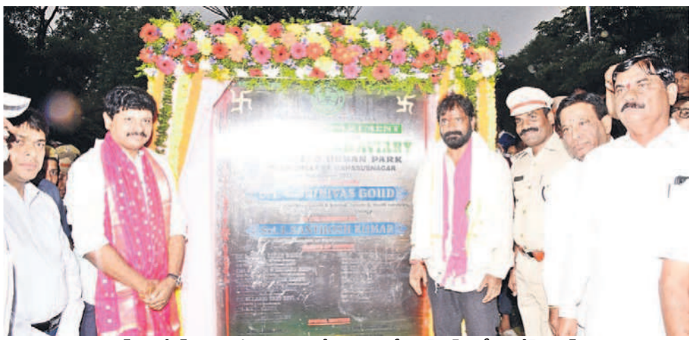
బర్డ్స్ ఎన్ క్లజ్ నిర్మాణానికి శంకుస్థాపన చేస్తున్న మంత్రి శ్రీనివాస్ గౌడ్, ఎంపీ సంతోష్ కుమార్

మహబూబ్ నగర్ మెట్టగడ్డ, అక్టోబర్ 2 : కేసీఆర్ ఎకో అర్బన్ పార్కును ప్రపంచంలోనే అత్యుత్తమమైనదిగా తీర్చిదిద్దేందుకు మంత్రి శ్రీనివాస్ గౌడ్ ఆహ్వానాలు కృషి చేస్తున్నారని, అందుకు పూర్తి సహకారం అందిస్తామని ఎంపీ జోగినపల్లి సంతోష్ కుమార్ అన్నారు. మహబూబ్ నగర్ లోని కేసీఆర్ ఎకో అర్బన్ పార్కులో రూ.2.70కోట్లతో నిర్మించనున్న బర్డ్స్ ఎన్ క్లజ్ లను ఎంపీ, మంత్రితో కలిసి సోమవారం ప్రారంభించారు. అనంతరం 28వేల ఎకరాల్లో దేశంలోనే అతిపెద్ద జంగల్ సఫారీతోపాటు రెండు సఫారీ వానానాలను జెండా ఊపి ప్రారంభించి ఆ వానానాలోనే వానీటవర్ వరకు వెళ్లి అటవీ ప్రాంతాన్ని తిలకించారు. అనంతరం అక్కడ నిర్వహించిన విలేజరుల సమావేశంలో మంత్రి శ్రీనివాస్ గౌడ్ మాట్లాడారు. గ్రీన్ ఇండియా చాంపియన్ డ్యారా పచ్చదనాన్ని పెంచి పర్యావరణాన్ని కాపాడుతున్న ప్రకృతి ప్రేమి కుడు ఎంపీ సంతోష్ చేతుల మీదుగా జంగల్ సఫారీని ప్రారంభించుకోవడం సంతోషంగా ఉందన్నారు. పదేండ్ల సీఎం కేసీఆర్ పాలనలో తెలంగాణ అద్భుత ప్రగతి సాధించిందన్నారు. తాగు, సాగునీరు, మెడికల్, ఇంజనీరింగ్ కళాశాలలు, ఇటీవలే ఇలా ఎన్నో ఏర్పాటు చేసుకున్నామని తెలిపారు.