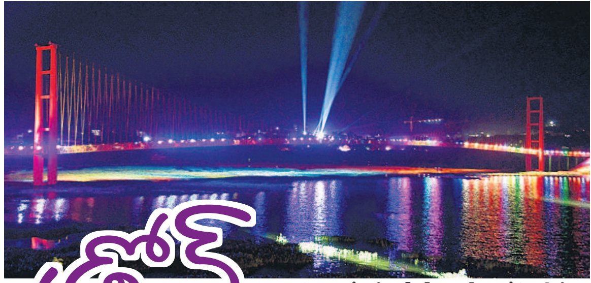
పాలమూరులో వి ఎన్ ట్యాంక్ బండ్ వద్ద విద్యుత్ కాంతుల్లో సస్పెన్షన్ లైట్స్