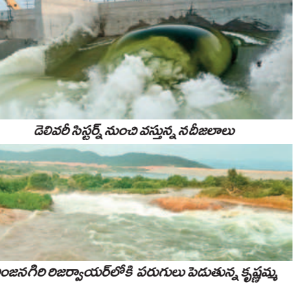
దెలివరీ సిస్టర్స్ నుంచి వస్తున్న నదీజలాలు

కొల్హాపూర్, సెప్టెంబర్ 2 : పాలమూరు-రంగారెడ్డి ఎత్తిపోతల పథకంలో భాగంగా నారాపూర్ (అంజనగిరి) రిజర్వాయర్ లోకి సోమవారం వరకు పంపింగ్ కొనసాగింది. గత నెల 27వ తేదీ సాయంత్రం మోటర్ ను ఆన్ చేయగా సోమవారం మధ్యాహ్నం వరకు నడిపించి ఆపేశారు. కాగా రిజర్వాయర్ లోకి 1.5 టీఎంసీల నీరు చేరినట్లు సంబంధిత ఇంజనీర్ తెలిపారు. 8.51 టీఎంసీల సామర్థ్యంతో నిర్మించిన నారాపూర్ (అంజనగిరి) రిజర్వాయర్ లోకి సిస్టర్స్ నుంచి కృష్ణాజలాల సురగలు కక్కుతూ పరుగులు తీశాయి. అయితే రిజర్వాయర్ ను సామర్థ్యం మేరకు నింపకుండా బండ్ పటిష్ట కోసం 2 టీఎంసీలతో నింపుతామని ప్రాజెక్ట్ ఇంజనీరింగ్ అధికారి తెలిపారు.