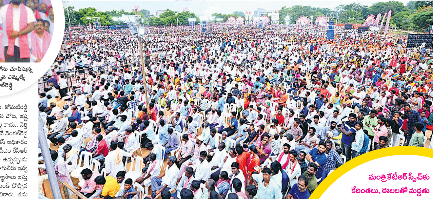
నల్లగొండ ఎన్టీ కాళేశలో బహిరంగ సభకు భారీగా హాజరైన జనం