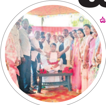
స్పీకర్ పోచారం శ్రీనివాసరెడ్డికి మద్దతు తెలుపుతున్న వర్షా ఆర్కవైశ్య సంఘం సభ్యులు

ఉమ్మడి జిల్లాలో బీఆర్ఎస్ కు రోజురోజు మద్దతు పెరుగుతున్నది. సబ్బండ వర్గాలు అభివృద్ధికి పట్టం కడుతున్నాయి. బీఆర్ఎస్ అభ్యర్థులకు మద్దతుగా ఏకగ్రీవ తీర్మానాలు జోరందుకున్నాయి. గ్రామాలను అభివృద్ధి పథంలో నడుపుతున్న బీఆర్ఎస్ కు జనం నీరాజనాలు పలుకుతున్నారు. 60 ఏండ్లలో జరగని అభివృద్ధిని తొమ్మిదేండ్లలోనే చేసి చూపిన గులాబీ పార్టీ అభ్యర్థులను భారీ మెజారిటీతో గెలిపించుకుంటామని స్పష్టం చేస్తున్నారు. గ్రామాల్లో తీర్మానాలు జోరందుకోవడంతో నోటిఫికేషన్ విడుదలకు ముందే ఎన్నికల సందడి నెలకొన్నది.