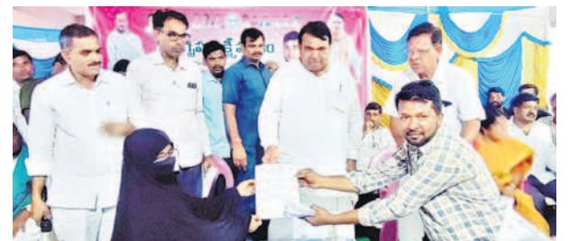
గృహలక్ష్మి లబ్ధిదారులకు ప్రాసీడింగ్ కాపీలను అందజేస్తున్న స్పీకర్ పోచారం