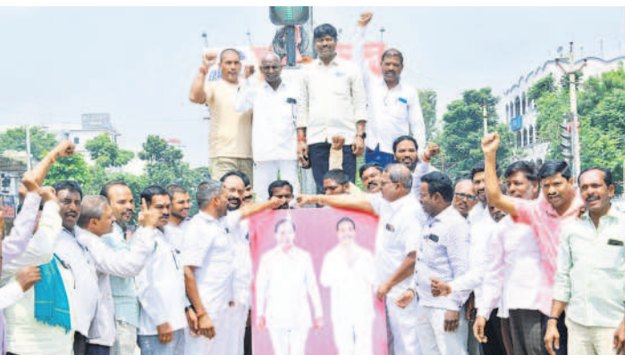
సీఎం కేసీఆర్ చిత్రపటానికి క్షీరాభిషేకం చేస్తున్న రేషన్ డీలర్లు, బీఆర్ఎస్ నాయకులు

కామారెడ్డి, అక్టోబర్ 2 : రేషన్ డీలర్లకు ప్రభుత్వం రెండింతలు కమీషన్ పెంచుతూ జీవో జారీ చేయడంపై హర్షాతిరేకాలు వ్యక్తమవుతున్నాయి. ఈ మేరకు కామారెడ్డి జిల్లా కేంద్రంలోని నిజాంసాగర్ చౌరస్తా వద్ద రేషన్ డీలర్లు సోమవారం సీఎం కేసీఆర్ చిత్రపటానికి క్షీరాభిషేకం చేశారు. ఈ సందర్భంగా వారు మాట్లాడుతూ.. క్వింటాలుకు గతంలో రూ.70 ఉండగా.. ఏకంగా రెండింతలు పెంచుతూ రూ.140 ప్రకటించినది