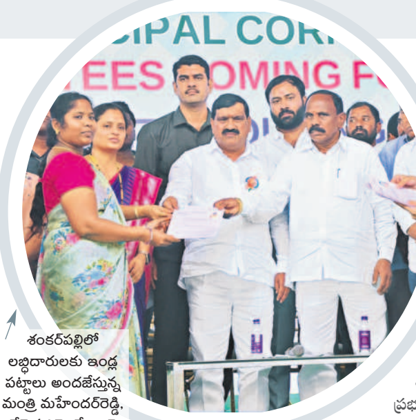
శంకర్ పల్లిలో లబ్ధిదారులకు ఇండ్ల పట్టాలు అందజేస్తున్న మంత్రి మహేందర్ రెడ్డి, చేపెళ్ల ఎమ్మెల్యే కాలే యాదయ్య

-రంగారెడ్డి, అక్టోబర్ 2 (నమస్తే తెలంగాణ)