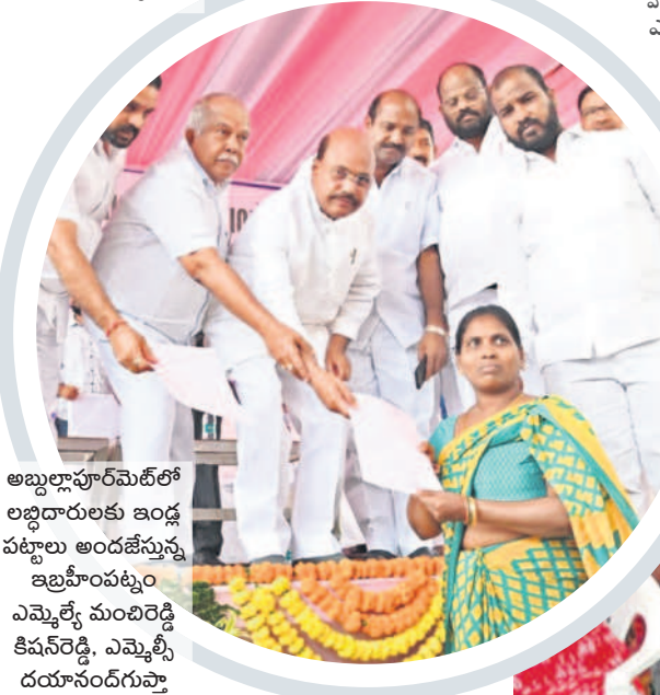
అబ్దుల్లాపూర్ మేట్ లో లబ్ధిదారులకు ఇండ్ల పట్టాలు అందజేస్తున్న ఇబ్రహీంపట్నం ఎమ్మెల్యే మంచారెడ్డి కిషన్ రెడ్డి, ఎమ్మెల్సీ దయానంద్ గుప్తా