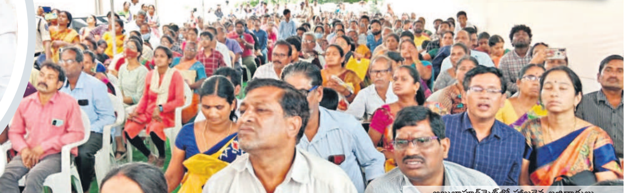
అబ్దుల్లాపూర్ మేట్ లో హాజరైన లబ్ధిదారులు