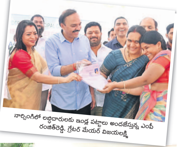
నార్సింగిలో లబ్ధిదారులకు ఇండ్ల పట్టాలు అందజేస్తున్న ఎంపీ రంజిత్రెడ్డి, గ్రేటర్ మేయర్ విజయలక్ష్మి