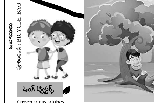
జవాబులు పూలంపండి : BICYCLE, BAG ఓంగ్ ట్రిప్లెట్స్ Green glass globes glow greenly.

లేదు. ఎందుకంటే నేనంటే పడనివాళ్లు.. నేను చాలా బద్దకస్తుణ్ణి నావైపు తప్పుడు ప్రచారం చేశారు!" అని బదులిచ్చాడు. అప్పుడు హరి.. "నేను ఎలాగా ఖజానా చూసుకునే ఉద్యోగమే చేస్తున్నాను కదా! అక్కడి ధనాగారంలోని డబ్బును లెక్క పెట్టడానికి నీతిమంతులైన ఉద్యోగులు కావాలి. నువ్వు రేపు ఉదయాన్నే రాజ భవనానికి రా! పనికి తగ్గ ఫలితం ఉంటుంది!" అని చెప్పాడు. గిరి ఇంటికి వెళ్లి తన భార్యతో విషయం చెప్పాడు. వెంటనే ఆమె కూడా.. "ధనాగారంలో పని అంటే.. ఎంతో గౌరవం! నువ్వు రేపు ఉదయాన్నే వెళ్లి పనిలో చేరు!" అని చెప్పింది.