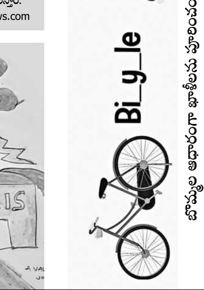
బొమ్మల ఆధారంగా ఖాళీలను పూరించండి