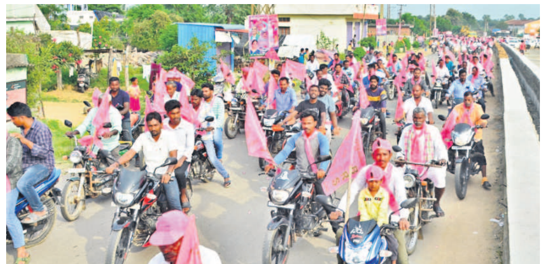
రామాయంపేటలో బీఆర్ఎస్ నాయకులతో బైక్ ర్యాలీగా వస్తున్న మంత్రి