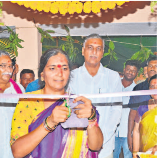
ఆర్డీసో కార్యాలయాన్ని ప్రారంభిస్తున్న ఎమ్మెల్యే పద్మాదేవేందర్ రెడ్డి, మంత్రి