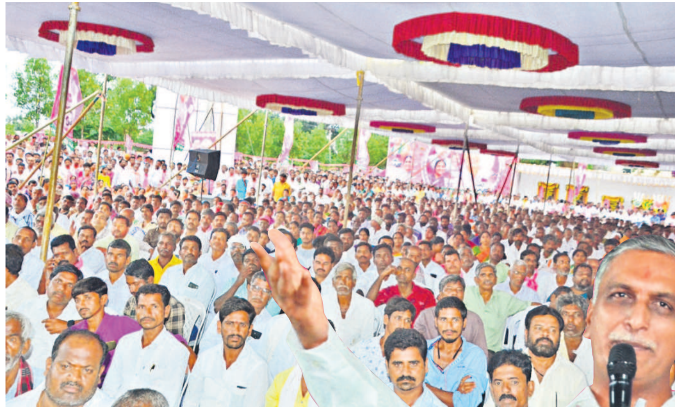
రామాయంపేట సభకు హాజరైన బీఆర్ఎస్ కార్యకర్తలు, ప్రజలు