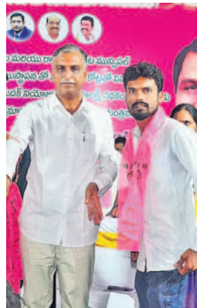
బీఆర్ఎస్ లో చేరిన యువకులు