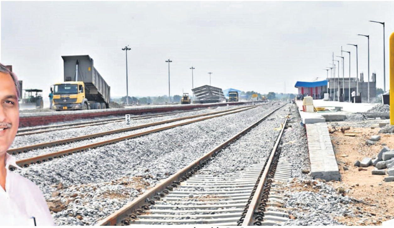
సిద్దిపేట రైల్వేస్టేషన్ ట్రాక్‌లు

కేంద్ర కార్యకర్త శాఖ మంత్రిగా ఉన్నప్పుడు రాష్ట్ర ప్రభుత్వ మూల డేంట్ వాటాగా మొత్తం ఖర్చు భరించి భూసేకరణ, రైల్వే ఏర్పాటుకు అవసరమైన నిధుల్లో మూడో వంతు సమకూర్చడం, రైల్వే నిర్మాణం అసంతరం ఐడెండ్ పాటు రైల్వేకు వచ్చే సమస్యలను రాష్ట్ర ప్రభుత్వం భరించడం అనే అగ్రిమెంట్‌తో మనోహరాబాద్ నుంచి గజ్వేల్, సిద్దిపేట, సిరిసిల్ల, వేములవాడ మీదుగా కొత్తపల్లి కరీంనగర్ వరకు 151 కిలోమీటర్ల రైల్వేలైన్ మంజూరు చేయించారు. అప్పట్లో రాష్ట్రంలో వైసీపీ రాజశేఖర్‌రెడ్డి ముఖ్యమంత్రిగా అధికారంలో ఉన్న కాంగ్రెస్ ప్రభుత్వం రాష్ట్రం వాటాగా చెల్లించాల్సిన నిధులు చెల్లించకపోవడం, భూసేకరణ చేయకపోవడం కారణంగా 2014 వరకు రైల్వే ఏర్పాటుకు సలబం డివిడీ ఎలాంటి పనులు ప్రారంభం కాలేదు. 2014లో తెలంగాణ రాష్ట్రాన్ని సాధించి ముఖ్యమంత్రిగా బాధ్యతలు స్వీకరించిన అసంతరం సీఎం కేసీఆర్ మనోహరాబాద్ - కొత్తపల్లి రైల్వేలైన్ ఏర్పాటుపై ప్రత్యేక శ్రద్ధ పెట్టి నిధులు విడుదల చేశారు. త్వరగా భూసేకరణ చేయడంతో రైల్వే చోరట్లో ఎప్పుడూ లేని విధంగా వేగంగా రైల్వే లైన్ ఏర్పాటు పనులు జరుగుతున్నాయి.