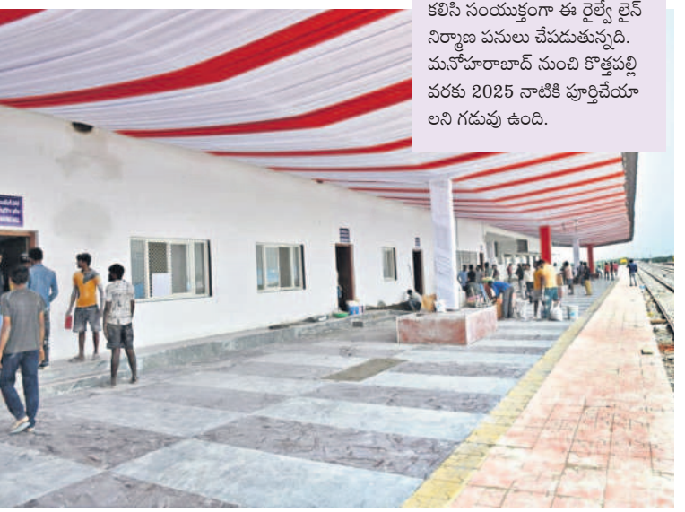
సిద్దిపేట రైల్వేస్టేషన్‌లోని రైల్వేస్టాల్ ఫాం