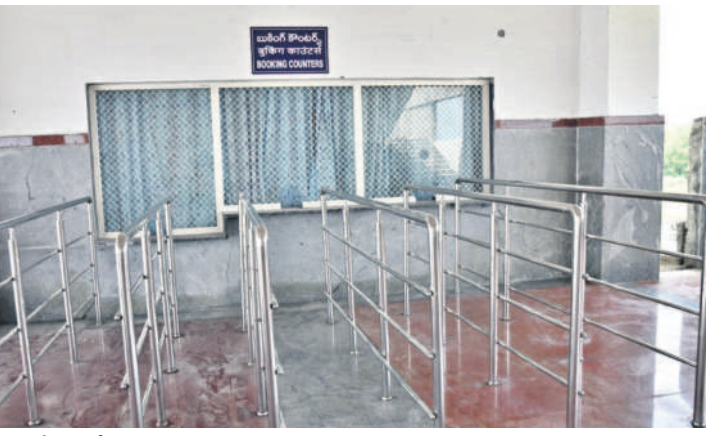
సిద్దిపేట రైల్వేస్టేషన్లో ఏర్పాటు చేసిన టీకెట్ బుకింగ్ కౌంటర్