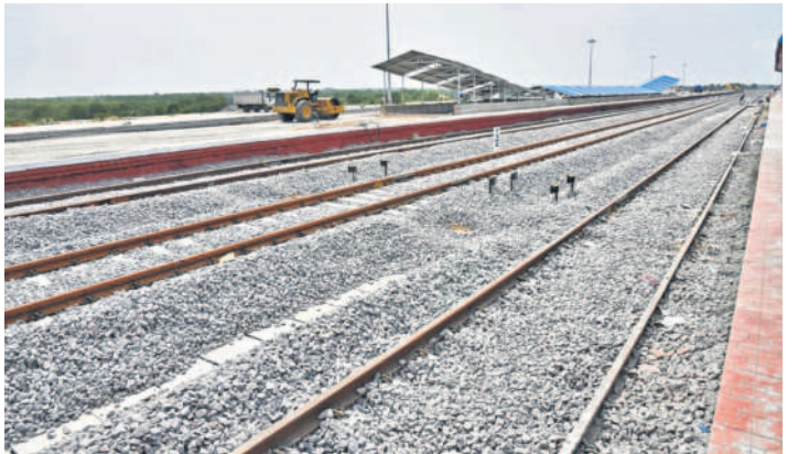
సిద్దిపేట రైల్వేస్టేషన్ వద్ద రైల్వేట్రాక్ లైన్లు

దూరంలో కొండపోవచ్చు దేవాలయం ఉంది. ఈ దేవాలయం పునరుద్ధరణకు ప్రభుత్వం కలసింది. అక్కడి నుంచి మరో 25 కి.మీ దూరంలో భక్తల కొంగు బంగారం కొమురవెల్లి మల్లన్న ఆలయం ఉంది. ఇక్కడికి ప్రాంతాలకు వెళ్లే ప్రయాణీకులకు వెసులుబాటు కలుగుతున్నది. మనోహరాబాద్ నుంచి సిద్దిపేట వరకు రైలు సేవలు ఉన్నాయి. గజ్వేల్ ప్రాంతంలో పెద్ద ఎత్తున పరిశ్రమలు ఏర్పాటువుతున్నాయి. కాలవస్య ప్రారంభమై రాకపోకలు సాగిస్తున్న విషయం తెలిసిందే. ఇక్కడి రైల్వే రేక్ పాయింట్ ఏర్పాటు ద్వారా విరువులను తీసుకువచ్చి జిల్లాలోని అన్ని ప్రాంతాల రైలుకు సరఫరా చేస్తున్నారు. దీంతో విరువులను తీసుకువచ్చడానికి ససత్వంలో రేక్ పాయింట్‌కు వెళ్లాలనే శ్రమ తగ్గింది.