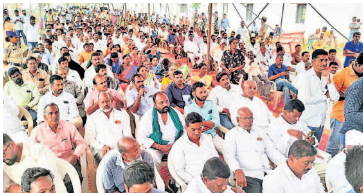
సభకు హాజరైన ప్రజలు, అభిమానులు, బీఆర్ఎస్ శ్రేణులు