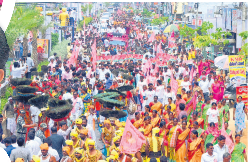
సూర్యాపేటలో భారీ ర్యాలీతో మంత్రులకు స్వాగతం

బీఆర్ఎస్ శ్రేణులతో దండల్లిని భానుపురి కళాకారుల విన్యాసాలు.. కోలాటలతో నృత్యాలు భారీ ర్యాలీతో మంత్రులు కేటీఆర్, జగదీశ్వర్ కి ఘన స్వాగతం దారి పాదవునా మంగళ హారతులు, గజమాలలతో సత్కారాలు జై కేసీఆర్.. జై కేటీఆర్.. జై జగదీశ్వర్ నినాదాలతో హోరెత్తిన సూర్యాపేట వీధులు