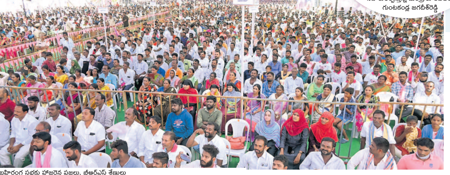
బహిరంగ సభకు హాజరైన ప్రజలు, బీఆర్ఎస్ శ్రేణులు