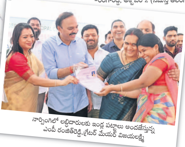
నార్సింగిలో లబ్ధిదారులకు ఇండ్ల పట్టాలు అందజేస్తున్న ఎంపీ రంజిత్రెడ్డి, గ్రేటర్ మేయర్ విజయలక్ష్మి