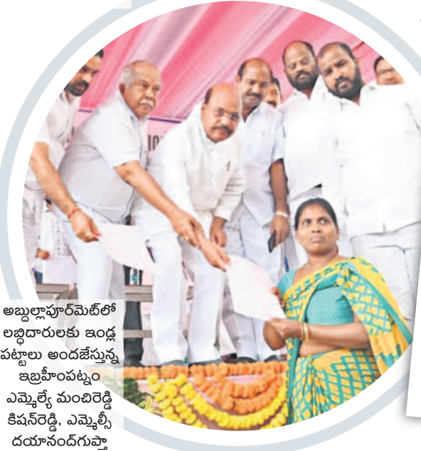
అబ్దుల్లాపూర్ మెట్లో లబ్ధిదారులకు ఇండ్ల పట్టాలు అందజేస్తున్న ఇబ్రహీంపట్నం ఎమ్మెల్యే మంచెరెడ్డి కిషన్ రెడ్డి, ఎమ్మెల్యే దయానంద్ గుప్తా