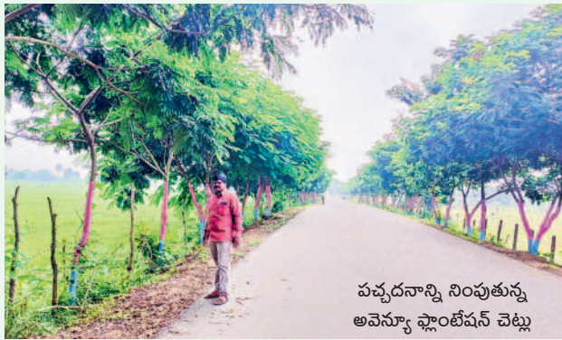
పచ్చనాన్ని నింపుతున్న అవెన్యూ ఫ్లాంటేషన్ చెట్లు

విశాలమైన రోడ్లు, పచ్చని చెట్లు గ్రామంలో ప్రభుత్వ నిధులతో ప్రజల సౌకర్యం కోసం విశాలమైన సీసీ రోడ్లు, డ్రైనేజీలు నిర్మించారు. నాడు ఇరుకైన రోడ్లతో ఇబ్బంది పడ్డ ప్రజలు నేడు విశాలమైన రోడ్లతో సంతోషం వ్యక్తం చేస్తున్నారు. హరితహారంలో భాగంగా రహదారులకు ఇరు వైపులా నాణ్య మొక్కలను ప్రత్యేక చొరవతో సంరక్షించడంతో పచ్చని చెట్లుగా మారి బాటసారులకు, గ్రామస్థులకు ఆహ్లాదాన్ని పంచుతున్నాయి.