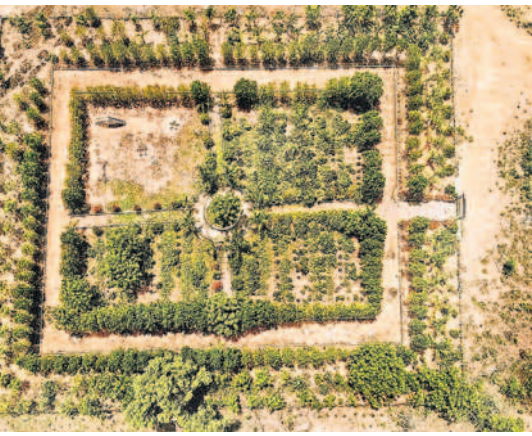
బొమ్మపూర్ పల్లె ప్రకృతి వనంలో నాణ్య మొక్కలు