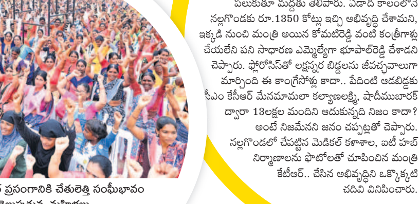
మంత్రి కేటీఆర్ ప్రసంగానికి చేతులెత్తిన సంఘీభావం తెలుపుతున్న మాజీ శాఖలు