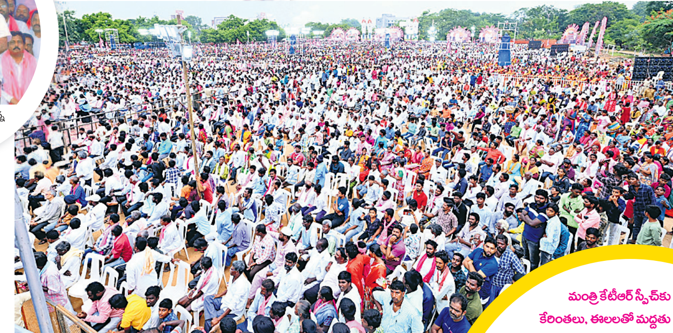
నల్లగొండ ఎన్టీ కాళేశ్వరం సభకు భారీగా హాజరైన జనం

కీక్కిరిసిన ఎన్టీ కాళేశ్వరం గ్రాండ్ నల్లగొండ, ఆక్టోబర్ 2 : నల్లగొండలో గులాబీ ఔడూ ఎగురేస్తే పట్టణాన్ని పూర్తిగా పునర్నిర్మించుని చెప్పిన సీఎం కేసీఆర్ హామీకి అనుగుణంగా నల్లగొండ డిమా రూ.1350 కోట్లతో అభివృద్ధి చేయించినందుకు ఆయనకు కృతజ్ఞతను తెలుపడంతోపాటు పలు అభివృద్ధి పనుల ప్రారంభోత్సవాలను, శంకుస్థాపనల సమయంలో ఎన్టీ కాళేశ్వరం సోమవారం నిర్వహించిన ప్రగతి నివేదన సభ ప్రజ్వలిల్లింది. బహిరంగ సభకు జనం ఊహించని రీతిలో హాజరు కావడంతో కళాశాల ప్రాంగణం కీక్కిరిసింది. అంతకుముంది బయలు ఆయా ప్రాంతాల్లో నెల