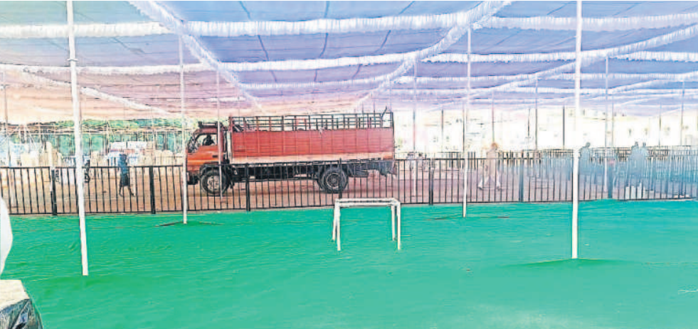
నిర్మల్ పట్టణంలోని ఎన్టీఆర్ మిల్ స్టేడియంలో వేసిన పామాయిలాలు