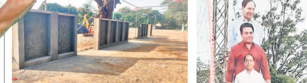
అభివృద్ధి పనులకు శంకుస్థాపన చేసేందుకు ఏర్పాటు చేస్తున్న శిలాఫలకాలు