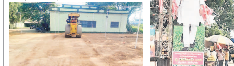
సమీకృత మార్కెట్ నిర్మించే స్థలంలో చదును చేస్తున్న రోడ్డు రోలర్