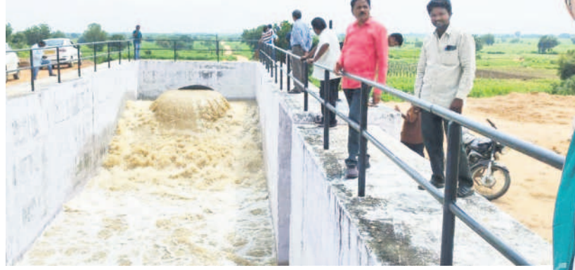
దిలావర్ పూర్ పంచాయితీ వద్ద త్రయంబకేశ్వరి భాగంగా నీటిని ఎత్తిపోస్తున్న సిస్టర్న్

నిర్మల్, అక్టోబర్ 3 (నమస్తే తెలంగాణ) : రెండు దశల్లోలాగా ఎదురు చూస్తున్న గోదావరి జలాల ఎత్తిపోతల పథకం ఎత్తిపోతల సాకారం సారించింది. దీంతో పనుల్లో వేగం పుంజుకున్నది. కాగా, ప్యాకేజీ 27 పనులు ఇప్పటికే 70 శాతం పూర్తి కావడంతో నిర్మల్ నియోజకవర్గంలోని ప్రతి ఎకరాకు సాగు నీరు దండమన్నది. రూ.714 కోట్లతో చేపట్టిన 27 ప్యాకేజీ ద్వారా నిర్మల్ నియోజకవర్గంలోని 99 గ్రామాల్లోని దాదాపు 50 వేల ఎకరాలకు సాగునీరు అందనున్నది. అలాగే రూ.525 కోట్లతో చేపట్టిన 28 ప్యాకేజీ కింద ముఠోల్ నియోజకవర్గంలోని 58 గ్రామాల్లోని 50 వేల ఎకరాల ఆయకట్టుకు సాగునీరు అందనున్నది. అంతే కాకుండా నిర్మల్, జగిత్యాల జిల్లాల్లోని 18,016 ఎకరాలను స్థిరీకరించడం కోసం మామడ మండలం పొస్కోల్ వద్ద గోదావరిపై సడద్యూల్ట్ బ్యారేజీ పనులు చివరి దశకు చేరుకున్నాయి. ఆయా పనులు పూర్తయితే నిర్మల్ జిల్లాలోని చివరి ఆయకట్టుకు సాగు నీరు దండమన్నది.