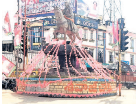
గులాబీ మయమైన నిర్మల్ లోని శివాజీ చౌక్

నిర్మల్, అక్టోబర్ 3 (నమస్తే తెలంగాణ) : ఐటీ, పురపాలక శాఖ మంత్రి కల్వకుంట్ల తారకరామారావు బుధవారం నిర్మల్ నియోజకవర్గంలో పర్యటించనున్నారు. మంత్రి ఇంద్రకణ్ఠరెడ్డితో కలిసి రూ.1,157 కోట్ల అభివృద్ధి పనులకు శంకుస్థాపన, ప్రారంభోత్సవాలు చేయనున్నారు. ముందుగా ఉదయం 9.50 గంటలకు హిల్ క్యాస్టర్ ద్వారా దిలావర్ పూర్ మండలం గుండంపల్లికి చేరుకుంటారు. గ్రామ శివారులోని గోదావరి నది వద్ద నిర్మించిన ప్యాకేజీ 27 ఎత్తిపోతల పథకం పంపెహ్సాన్ ను స్ట్రీట్ ఆన్ చేసి ప్రారంభిస్తారు. అక్కడి నుంచి రోడ్డు మార్గం ద్వారా దిలావర్ పూర్ గ్రామ శివారులో నిర్మించిన సిస్టర్న్ వద్దకు చేరుకుంటారు. ఇక్కడే పంపింగ్ ద్వారా కాలువలోకి సాగు నీరు చేరుతోంది. కాలువలోకి గోదావరి జలాల వేరగానే మంత్రులు కేటీఆర్, ఇంద్రకణ్ఠరెడ్డిలు గంగమ్మకు వాయిదా సమర్పించి పూజలు చేస్తారు. అనంతరం 11.10 గంటలకు సోన్ మండలంలోని పాకేపల్లె గ్రామ శివారుకు చేరుకుంటారు. అక్కడే 40 ఎకరాల సిస్టర్న్ లో రూ.250 కోట్ల నిర్మించనున్న ఆయిల్ పామ్ ఫ్యాక్టరీ పనులకు శంకుస్థాపన చేస్తారు. అనంతరం నిర్మల్ తోపాటు, నిజామాబాద్, జగిత్యాల జిల్లాల నుంచి వచ్చిన ఆయిల్ పామ్ సాగు చేస్తున్న రైతులతో నిర్వహించే సమావేశంలో మంత్రి పాల్గొంటారు. అనంతరం మద్యాహ్నం 12.15 గంటలకు నిర్మల్ పట్టణంలోని పాత తహసీల్ కార్యాలయ స్థలం వద్దకు చేరుకుంటారు. అక్కడే రూ.10.15 కోట్లతో నిర్మించనున్న సమీకృత మార్కెట్ కు శంకుస్థాపన చేస్తారు. ఇదే ప్రాంతంలో పరి కౌన్సిల్ అభివృద్ధి పనులకు సంబంధించిన శిలాఫలకాలను మంత్రి అవిష్కరిస్తారు. వీటిలో నిర్మల్ పట్టణంలో రూ. 2 కోట్ల టీయాఎ షిఫ్ట్ నీ నిధులతో నిర్మించే డోబీపూట్ పనులు, రూ.4 కోట్ల టీయాఎ షిఫ్ట్ నిధులతో మార్కెట్ మౌలిక వసతుల కల్పన కోసం చేపట్టే పలు అభివృద్ధి పనులు ఉన్నాయి.