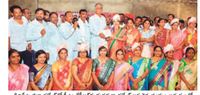
సిద్దిపేట జిల్లా గజ్వేల్ లో సీఎం కేసీఆర్ కు మద్దతుగా గజ్వేల్ అర్బన్ వెళ్ళ సంఘం ఆధ్వర్యంలో తీర్మాన పత్రాన్ని మంగళవారం మంత్రి హరీష్ రావుకు అందజేస్తున్న మహిళలు

ఆగని మహా మృత్యుఘోష ఔరంగాబాద్ ప్రభుత్వ దవాఖానలో మరో 18 మంది గోరూలు మృతి మృతుల్లో ఇద్దరు నవజాత శిశువులు నాండేలో మరో ఏడుగురి మరణం రెండవోట్లా 48 గంటల్లో 49 మంది.. పేద ప్రజల ప్రాణాలకు విలువ లేదా? షిండి సర్కారుపై విమర్శల ఆగ్రహం > 11