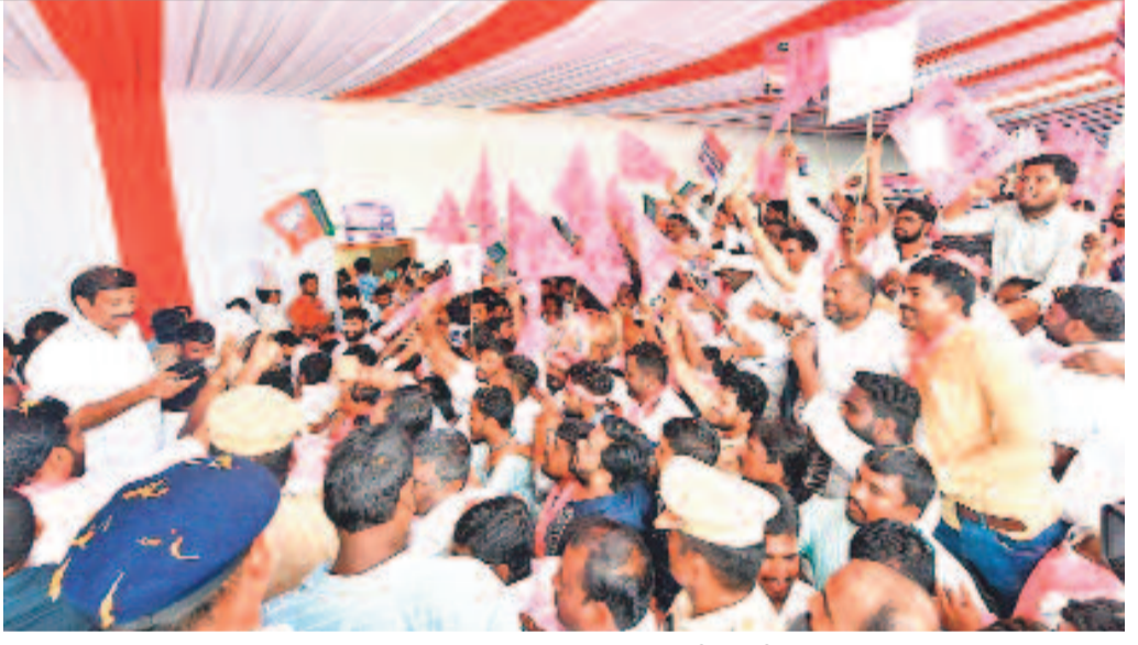
మంగళవారం సిద్దిపేట రైలు ప్రారంభోత్సవ కార్యక్రమంలో సీఎం కేసీఆర్, మంత్రి హరీష్, ఎంపీ ప్రభాకర్ రెడ్డి ఘోషోలు పెట్టినందుకు రైల్వే అధికారులపై, బీజేపీ నేతలపై ఆగ్రహం వ్యక్తం చేస్తున్న బీఆర్ఎస్ శ్రేణులు

హైదరాబాద్, అక్టోబర్ 3 (నమస్తే తెలంగాణ): ప్రధాని నరేంద్రమోదీ నిజామాబాద్ సభలో మాట్లాడిన తీరుపై తెలంగాణ ప్రజలు, మేధావులు విస్మయం వ్యక్తం చేస్తున్నారు. రాష్ట్రానికి కేంద్రం చేసేదిమీ లేకపోవటంతో చెప్పకోవటానికి ఏమీ లేక, రాష్ట్రప్రభుత్వంపై, సీఎం కేసీఆర్ పై వ్యక్తిగత విమర్శలకు దిగారని మండిపడుతున్నారు. మోదీ ప్రధాని పదవీకి తగిన రీతిలో మాట్లాడారని ఆగ్రహం వ్యక్తం చేస్తున్నారు. తన 9 ఏండ్ల పాలనలో తెలంగాణకు మోదీ ఇచ్చింది లేదు.. తెచ్చింది లేదు.. తరుమా తెలంగాణ రాష్ట్ర ఏర్పాటును విమర్శించటం తప్ప ఏనాడూ ప్రశంసించింది కూడా లేదు. ఇప్పుడు ఎన్నికల సమయంలో ఏం చెప్పుకోవాలో తెలియక సీఎం కేసీఆర్ పై రాజీకే లేని విమర్శలకు దిగుతున్నారని తెలంగాణవాదులు విమర్శిస్తున్నారు. ఏ రాష్ట్రంలో ఎన్నికల జరిగినా మోదీ ప్రచారానికి > 4వ పేజీలో