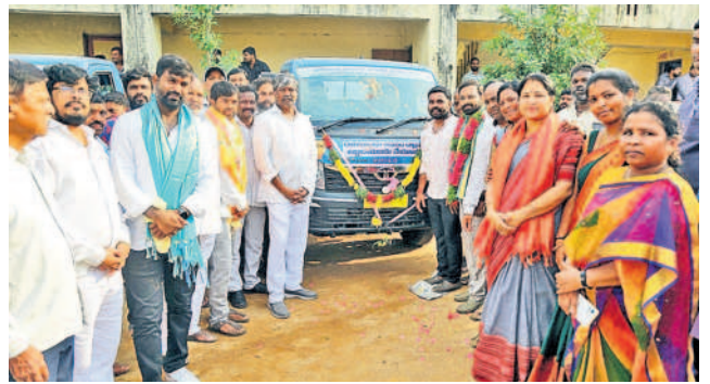
నూతన సీవరేజ్ డి సిల్లింగ్ వాహనాలను ప్రారంభిస్తున్న డిప్యూటీ సీకర్, డిప్యూటీ మేయర్ తదితరులు