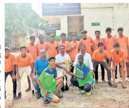
విజేత జట్టును అభినందించిన అధికారులు