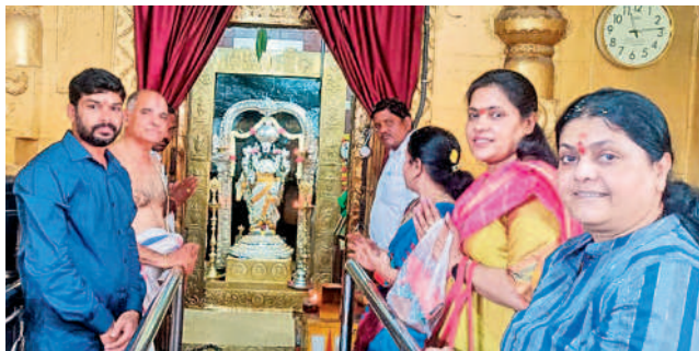
వేంకటేశ్వరస్వామికి పూజలు చేస్తున్న అర్చకులు, దర్శించుకుంటున్న భక్తులు