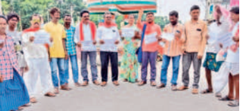
నిరసన తెలుపుతున్న నాయకులు