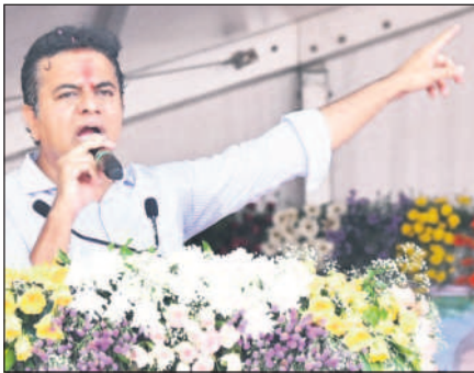
జగిత్యాల సభల్లో మాట్లాడుతున్న మంత్రి కేటీఆర్