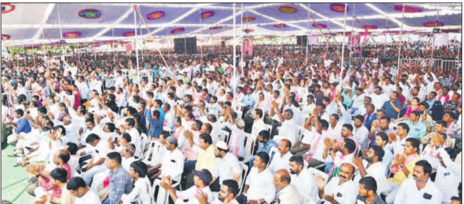
జగిత్యాలలో సభకు హాజరైన జనం