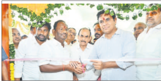
ధర్మపురి: మాతాశిశు సంరక్షణ కేంద్రాన్ని ప్రారంభిస్తున్న మంత్రి కేటీఆర్