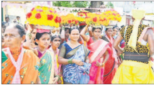
ధర్మపురి: బతుకమ్మలతో స్వాగతం పలుకుతున్న మహిళలు