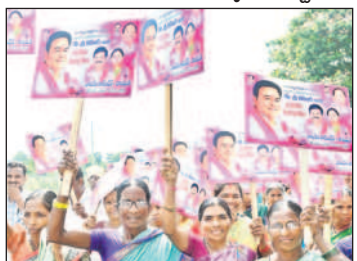
ధర్మపురిలో సభకు ఘోషారావంతో వస్తున్న మహిళలు