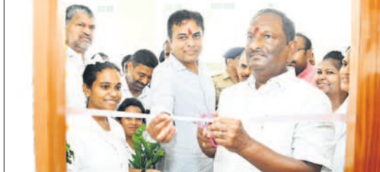
ధర్మపురి: దవాఖానలో రిబ్బన్ కట్ చేస్తున్న మంత్రులు