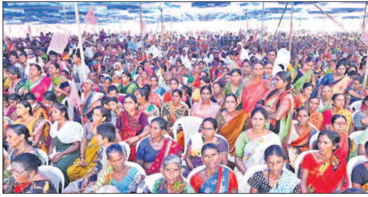
ధర్మపురి: ప్రగతి నివేదన సభకు హాజరైన జనం