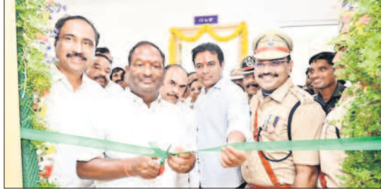
కలెక్టరేట్ : ఎన్నో ఛాంబర్ ను ప్రారంభిస్తున్న మంత్రి కొప్పుల ఈశ్వర్