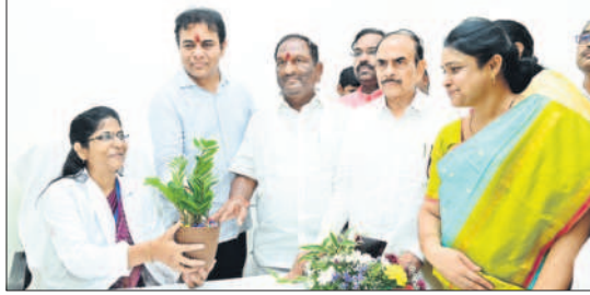
ధర్మపురి: మాతాశిశు సంరక్షణ కేంద్రంలో సూపరింటెండెంట్ కు బాధ్యతలు అప్పగిస్తున్న మంత్రులు కేటీఆర్, ఈశ్వర్