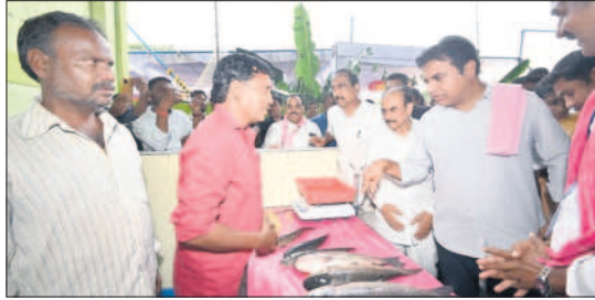
జగిత్యాల టౌన్ : చేపలు విక్రయిస్తున్న వ్యక్తిని పలుకరిస్తున్న మంత్రి కేటీఆర్