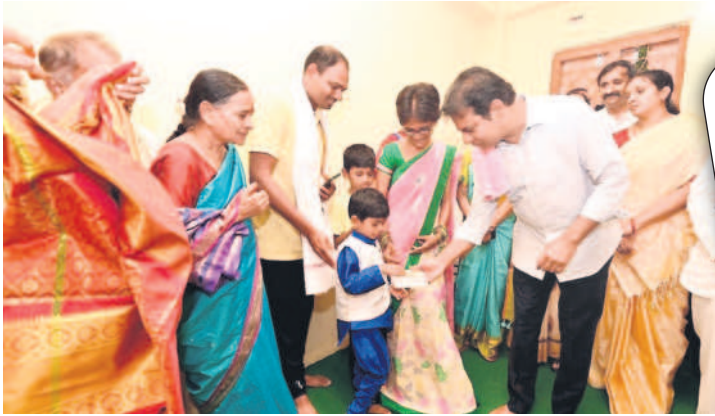
మల్కాల మండలం నూకవల్లి కేసీఆర్ కాలనీలో డబుల్ బెడ్రూం ఇంటిని ప్రారంభించిన అనంతరం మంత్రి కేటీఆర్ కు స్వీటులు అందజేస్తున్న అంకణ జ్యోత్స్న కుటుంబసభ్యులు