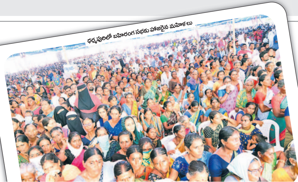
ధర్మపురిలో బహిరంగ సభకు హాజరైన మహిళలు