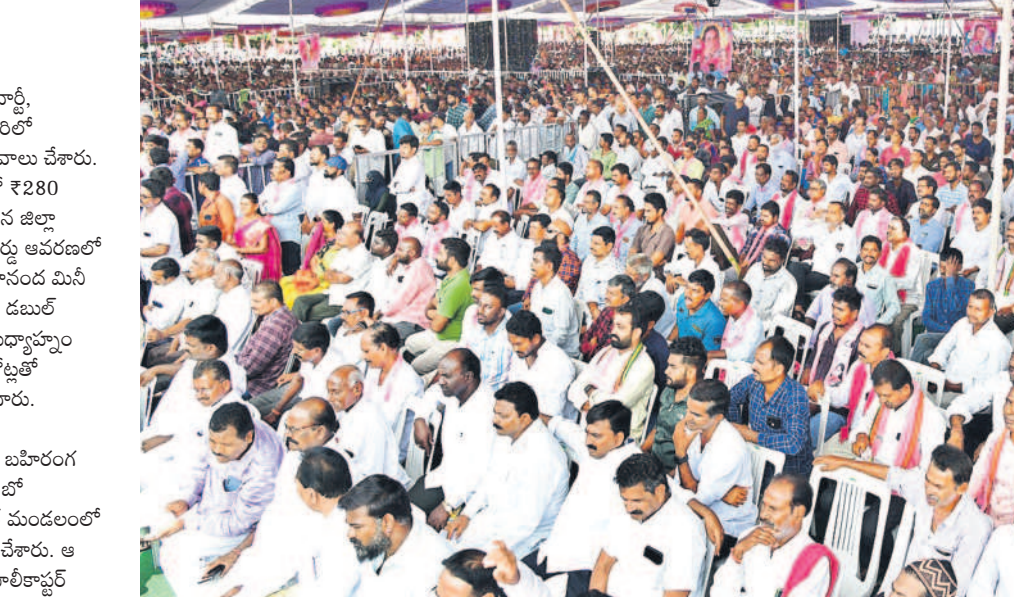
జగిత్యాల మినీ స్టేడియంలో బహిరంగ సభకు అనేకంగా హాజరైన జనం