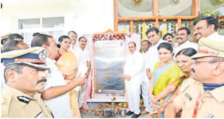
జగిత్యాలలో పోలీస్ ప్రధాన కార్యాలయ శిలాఫలకాన్ని ఆవిష్కరిస్తున్న మంత్రులు, ఎమ్మెల్యేలు