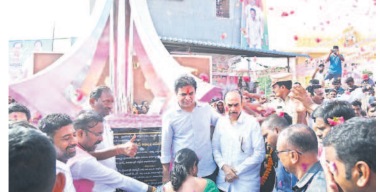
ధర్మపురి: పైలాన్ ను ఆవిష్కరిస్తున్న మంత్రులు కేటీఆర్, మహమూద్ అలీ, కొప్పల ఈశ్వర్