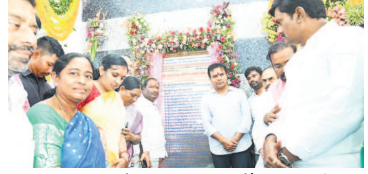
ధర్మపురి: మాతాశిశు సంరక్షణ కేంద్రాన్ని ప్రారంభిస్తున్న మంత్రులు కేటీఆర్, మహమూద్ అలీ, కొప్పల ఈశ్వర్, చిత్రంట్ల వివ బాల్య సుమన్, ఎంపీ బోధకుల వెంకటేశ్ నేతకాని