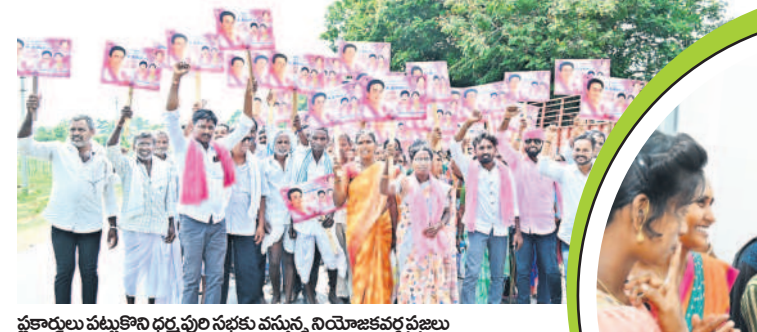
షకార్తులు పట్టుకొని ధర్మపురి సభకు వస్తున్న నియోజకవర్గ ప్రజలు

'కాంగ్రెస్ అంటే గతం. దాని పని ఏనాడో ఖచ్చితమేయింది. జీవనరీతి జగిత్యాల ప్రజలకు గతం లాంటి వారు. భవిష్యత్తు అంటే ఎమ్మెల్యే డాక్టర్ సంజయ్ మాత్రమే. జగిత్యాల నియోజకవర్గ అభివృద్ధికి కట్టుబడి ఉన్నాం. ఎమ్మెల్యే సంజయ్ కుమార్ కోరేటట్టు జగిత్యాల పట్టణంలో రైతులకు ఇబ్బందులు లేకుండా పట్టణ ప్రణాళికను రూపొందిస్తాం. అందర్ గ్రౌండ్ డ్రైనేజీ సిస్టమ్ రూపొందిస్తాం. పరి ఉత్పత్తి జగిత్యాల ప్రాంతంలో పరిశ్రమ పెరిగిన నేపథ్యంలో కోణాకు వెస్ట్ క్యూబ్ డాన్సం మరొక పరిశ్రమను ప్రోత్సహిస్తాం. జగిత్యాల ప్రాంతం మామిడి పంటకు ప్రసిద్ధి. మామిడి రైతుల కోసం పెన్షన్ లేదా కోకాకోలా కంపెనీలో ఏదో ఒక్కదాన్ని ఇక్కడికి తీసుకువస్తాం. ₹50 కోట్లతో మరో వెయ్యి డబుల్ బెడ్రూం ఇండ్ల నిర్మాణం సైకించే మొదలు. మీరు జగిత్యాల ఎమ్మెల్యేగా సంజయ్ కుమార్ ను 75 వేల మెజార్టీతో గెలిపించే బాధ్యత మీరు తీసుకోండి. ఈ నియోజకవర్గాన్ని రాష్ట్రంలోనే అగ్రగణ్యత తీర్చిదిద్దే బాధ్యతను నేను తీసుకుంటా. నియోజకవర్గ ప్రజలు అభివృద్ధి కోసం అడిగిన ప్రతి పనిని ముఖ్యమంత్రి చేస్తా. సమస్యలన్నీ పరిష్కరిస్తా. - మంత్రి కేటీఆర్