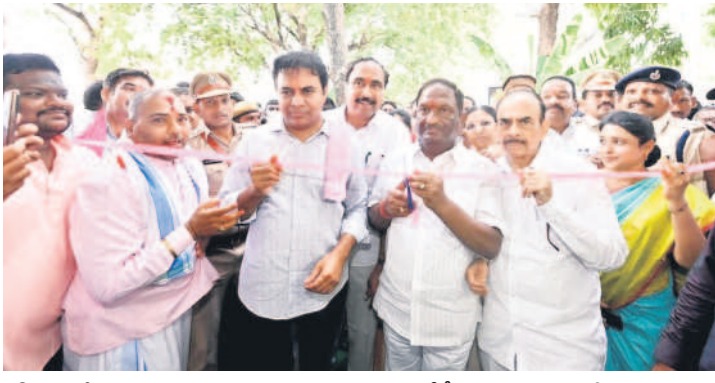
జగిత్యాలలో సమీకృత మార్కెట్ను ప్రారంభిస్తున్న మంత్రులు కేటీఆర్, మహమూద్ అలీ, కొప్పల ఈశ్వర్