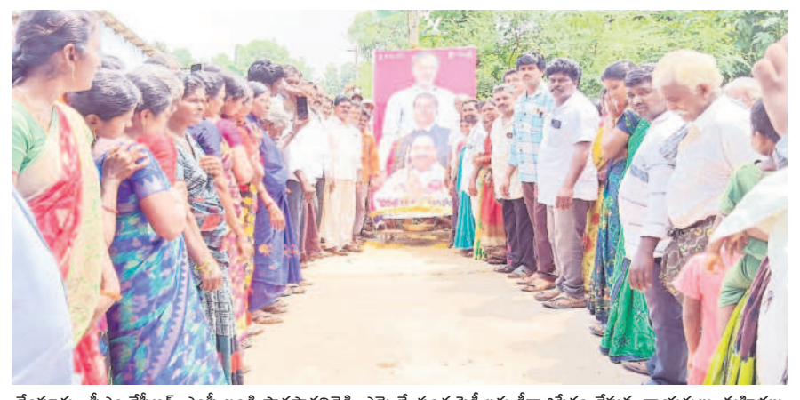
వేంసూరు : సీఎం కేసీఆర్, ఎంపీ బండే వార్షసారధిరెడ్డి, ఎమ్మెల్యే సంధ్ర కృషిలకు క్షీరాభిషేకం చేస్తున్న నాయకులు, మహిళలు

కల్వార, ఆక్టోబర్ 8 : అన్ని వర్గాల అభివృద్ధికి ప్రాధాన్యం ఇస్తున్న సీఎం కేసీఆర్ దళితలు మరింతగా అభివృద్ధి చెందడానికి దళితబంధు పథకాన్ని తీసుకొచ్చారు. తొలిసారిగా దళితబంధు పథకాన్ని ప్రవేశపెట్టిన తెలంగాణ ప్రభుత్వం హజారాబాద్ నియోజకవర్గంలో ప్రతి దళిత కుటుంబానికి రూ.10 లక్షల చొప్పున అందించినది. తర్వాత సత్తుపల్లి నియోజకవర్గంలోని పెనబల్లి మండలం కారాయిగూడెం, సత్తుపల్లి మండలం కిష్టాం గ్రామస్థులను పథకాన్ని వర్ధం పజ్జిణింది. కాగా.. ఎంజో విడతల్లో సత్తుపల్లి నియోజకవర్గంలోని ప్రతి దళిత కుటుంబానికి పథకాన్ని అందేలా చేస్తామని శనివారం సత్తుపల్లిలో జరిగిన సభలో రాష్ట్ర ఐటీ, పురపాలక శాఖ మంత్రి కేటీఆర్ ప్రకటించిన విషయం విదితమే. దీంతో దళిత సంఘాల నాయకులు, దళితలు హార్షం వ్యక్తం చేస్తున్నారు. గతంలో ఎమ్మెల్యే సంధ్ర వెంకటవీరయ్య నియోజకవర్గవ్యాప్తంగా అందరికీ దళితబంధు అందించాలని సీఎం కేసీఆర్ ధృష్టికి చురుమాడ్చి తీసుకెళ్లారు. ఈ క్రమంలోనే మంత్రి కేటీఆర్ సభలో ప్రకటించిన గంటలోనే సీఎం కేసీఆర్ జీవో జారీ చేసి దళితలపై ప్రేమను చాటుకున్నారు. నియోజకవర్గంలోని 34వేల దళిత కుటుంబాలకు ఒకేసారి పథకం అందించాలనే కృతనిశ్చయంతో ఎమ్మెల్యే సంధ్ర