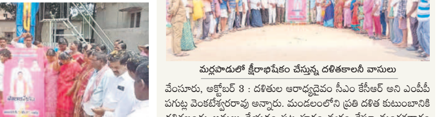
మధపాడులో క్షీరాభిషేకం చేస్తున్న దళితకాలనీ వాసులు

సత్తుపల్లి టౌన్, ఆక్టోబర్ 8 : నియోజకవర్గాన్ని దళిత పైలెట్ ప్రాజెక్టు కింద ప్రకటించినందుకు సీఎం కేసీఆర్, ఎమ్మెల్యే సంధ్ర వెంకటవీరయ్యకు కృతజ్ఞతలు తెలుపుతూ వారి