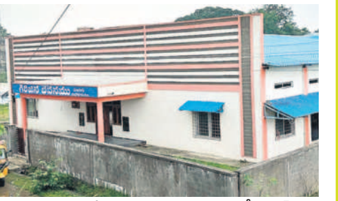
మణుగూరులో నిర్మించిన గిరిజన ఆదివాసీ భవన్, కమ్యూనిటీ హాల్

గొమ్మూరులో పంచాయతీ భవనం పూర్తవగా.. గుండాల మండలం కావనపల్లిలో పంచాయతీ కార్యాలయాన్ని ప్రభుత్వ వివే రేగా జేపీపల్లె ప్రారంభించారు. పండల కోట్లతో బీటీ, సీటీ రోడ్లు నియోజకవర్గంలో రహదారులను మెరుగ్గా తీర్చిదిద్దేందుకు ప్రభుత్వం పండల కోట్ల నిధులు మంజూరు చేస్తుండడంతో బీటీ, సీటీ రోడ్లు, వంతెనల నిర్మాణాలు చురుగ్గా జరుగుతున్నాయి. మణుగూరు, కరకగూడెం, అశ్వపురం, పినపాక, బూర్గంపహాడ్ మండలాల్లో ఈ పనులు జోరుగా సాగుతుండగా.. తాజాగా ఆళ్ల పల్లి, గుండాల మండలాల్లో బీటీ రోడ్లకు ప్రభుత్వ వివే రేగా శంకు స్థాపన చేశారు. గ్రామాల్లోని అంతర్గత రహదారులు సీటీ రోడ్లుగా మారుతున్నాయి. దీంతో గ్రామాల్లో ప్రజలకు పాలన దగ్గరైంది.. వైద్యం చెంకకు చేరింది. బూర్గంపహాడ్ మండలం తాళ్ల