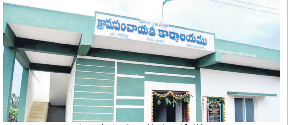
గుండాల మండలంలోని కావనపల్లి పంచాయతీ భవనం