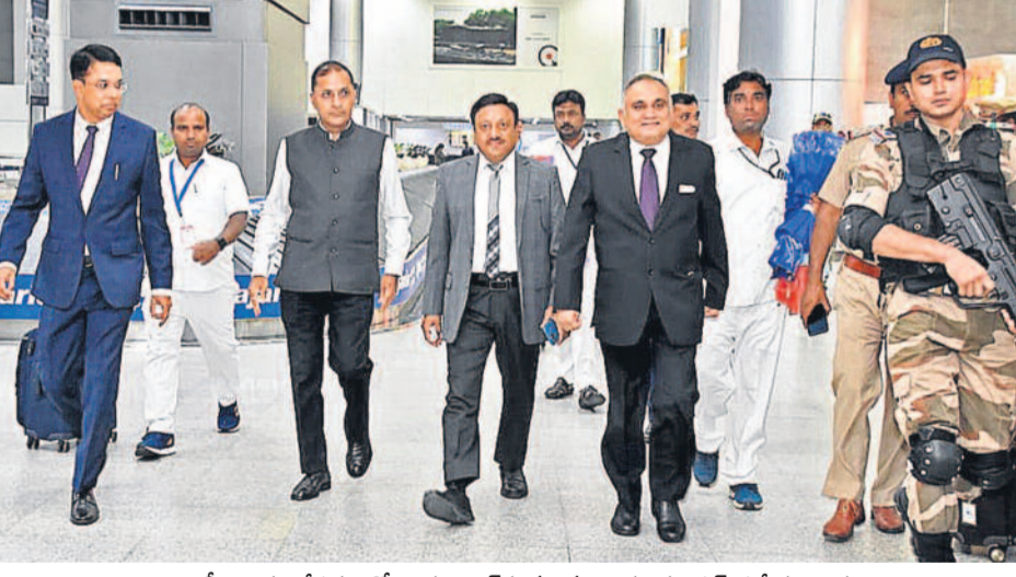
అసెంబ్లీ ఎన్నికల నేపథ్యంలో హైదరాబాద్ కు వచ్చిన ఎన్నికల కమిషన్ ప్రత్యేక బృందం

10 రోజుల్లో 2,500 డౌన్ దిగిస్తున్న బంగారం ధరలు రూ.58 వేల దిగువకు చేరిక మరో రూ.660 తగ్గిన తులం 2వేలు తగ్గిన కిలో వెండి > 14 పదోన్నతుల్లేకుండా టీచర్ల బదిలీలు 2 జోన్లలో ట్రాన్స్ ఫర్స్ > 7 విద్యాశాఖ షెడ్యూల్ విడుదల బ్రిటన్ లో > 11 హైదరాబాద్ హత్య గొడవను ఆపే ప్రయత్నంలో కత్తిపోట్లకు గురైన వృద్ధుడు