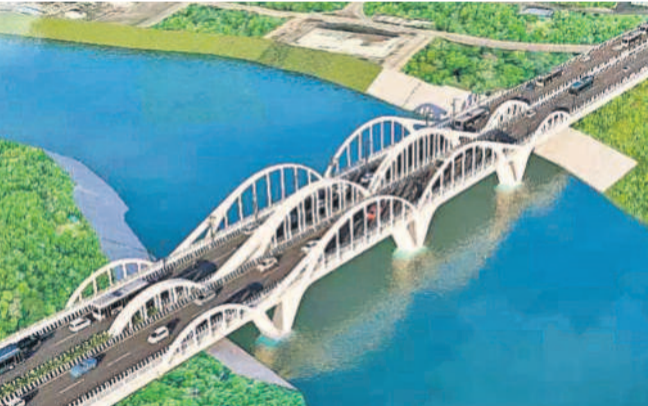
గోదావరి నీటిని తీసుకువస్తారు. గండిపేట నుంచి దిగువకు గోదావరి నీటిని మూసీలోకి వదలడం వల్ల మూసీనది సజీవ నదిగా మారబోతున్నది. దీన్ని ఎవరూ కలలో కూడా ఆహ్వానించడం లేదు. కానీ కేసీఆర్ కలలు కని, వాటిని సాకారం చేసి అద్భుతాలు సృష్టిస్తున్నారు.

హైదరాబాద్ నగరం, మూసీ నది అవిభక్త కలలను, స్వచ్ఛమైన మూసీనది ఒడ్డున అందాల హైదరాబాద్ నగరం నిర్మించబడింది. కానీ సీమాంధ్ర వలస పాలనలో వివక్ష, వినాశకర విధానాలతో హైదరాబాద్ నగరం తన ప్రభుత్వ కోల్పోయింది. మూసీ నదిని వారు మురికికూడుగా, దంపియ్యంగా మార్చారు. సీమాంధ్ర పాలకుల వల్ల హైదరాబాద్ లో జరిగిన విధ్వంసాన్ని, సలహాయం కోసం కేసీఆర్ గత కొద్దికాలంగా హైదరాబాద్ లో అనేక అభివృద్ధి కార్యక్రమాలను చేపట్టారు. హైదరాబాద్ నగరాన్ని పునఃనిర్మిస్తున్నారు. అలాగే మూసీనది పునరుద్ధరణ కోసం మూసీ అవర్ డెవలప్ మెంట్ కార్యక్రమాలను ఏర్పాటుచేయడమే కాకుండా గోదావరినీ మూసీనదితో అనుసంధానం చేసే మూత్రక కార్యక్రమానికి పూనుకున్నారు.