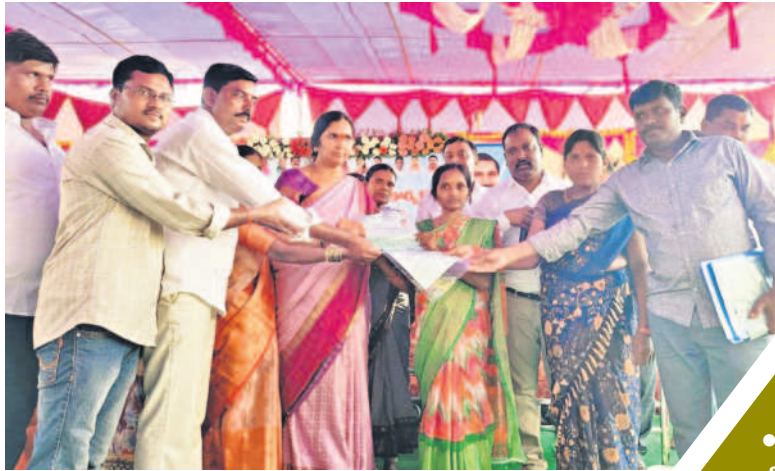
డబుల్ బెడ్రూం ఇండ్ల పట్టాలు అందజేస్తున్న మెడక్ ఎమ్మెల్యే పద్మాదేవేందర్ రెడ్డి