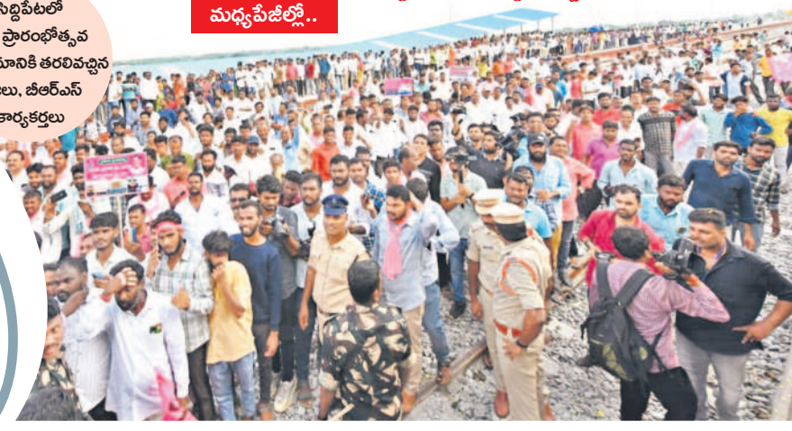
సిద్దిపేటలో రైలు ప్రారంభోత్సవ కార్యక్రమానికి తరలివచ్చిన ప్రజలు, బీఆర్ఎస్ కార్యకర్తలు

-సిద్దిపేట ప్రతినిధి/ సిద్దిపేట లర్నల్, అక్టోబర్ 3 (నమస్తే తెలంగాణ)