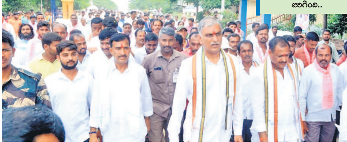
గజ్వేల్ మండలం బయ్యారంలో పర్యటిస్తున్న మంత్రి హరీశ్ రావు

గజ్వేల్, అక్టోబర్ 3 : గత ప్రభుత్వాల హయాంలో రైతు ఆత్మహత్యలు చూసి వాళ్లమని, తెలంగాణలో కేసీఆర్ వచ్చిన తర్వాత రైతుల ఆత్మహత్యల గౌరవం, ఆత్మహత్యలను భూముల విలువ పెరిగిందని, రైతే రాజు అనే నినాదం నిజం చేశారని ఆర్థిక, వైద్యారోగ్య శాఖల మంత్రి తన్నీరు హరీశ్ రావు అన్నారు. గజ్వేల్ లో మంగళవారం పత్తి మార్కెట్ ను ప్రారంభించిన సందర్భంగా రైతులను ద్వేషించి ఆయన మాట్లాడారు. కేసీఆర్ సీఎం రాకతో గజ్వేల్ లో పాత మార్కెట్ ను నేడు రూ. 4 కోట్లతో అద్భుతంగా మార్చి రైతే రాజుగా చేశారన్నారు. కాంగ్రెస్ హయాంలో రైతులు ఆత్మహత్యలు చేసుకునే వారన్నారు. సీఎం కేసీఆర్ రాకతో రైతుల్లో ఆత్మహత్యలను పెరిగిందని, రైతులందరూ అందించిన ప్రభుత్వం దేశంలోనే బీఆర్ఎస్ మాత్రమే నన్నాడు కాళ్ళనూ పీడను అందించి సంవత్సరంలో రెండు పంటలు పండించుకునే విధంగా రైతారని, పండించిన ప్రతి గింజనూ కొనుగోలు చేసే మద్దతు ధర కల్పిస్తున్న కేసీఆర్ ను మరచిపోవద్దన్నారు. గతంలో పాగు భూములను అమ్మితే ఐదారు లక్షలు వచ్చేవని, కానీ నేడు కొండామంటే ఎక్కడా కూడా భూములు దొరకడం లేదన్నారు. వానకాలం, యాసంగి పంటలు పండిస్తూనే కొంత మంది రైతులు కూరగాయలు మూడో పంటగా పెంచుకుంటున్నారన్నారు. దేశంలో 24 గంటల కరింట్ ఇచ్చే దమ్మున్న బీడర్ ఒక్క కేసీఆర్ మాత్రమేనన్నారు. గుంట ఎండకండా పంటలు తీసేలా కరింట్ ఇస్తున్న మహానియుడు కేసీఆర్ అన్నారు. గత కాంగ్రెస్ హయాంలో రైతులు ఎరువుల కోసం చెప్పులు బైన్లో పెట్టి నిలబడితే బస్తా కూడా దొరికేది కాదన్నారు. కానీ కేసీఆర్ ఎరువులు, విత్తనాలు, పెట్టుబడినాయం, పండించిన