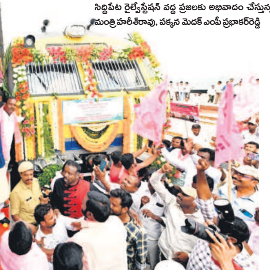
సిద్దిపేటలో రైలు ఎక్కుతున్న ప్రయాణికులు

సందడిగా సిద్దిపేట రైల్వే స్టేషన్ ఎన్నో ఏండ్లుగా ఎదురు చూస్తున్న సిద్దిపేట ప్రాంత వాసుల కల నెరవేరింది. రైలును చూసేందుకు చాలా మంది ప్రజలు రైల్వే స్టేషన్ కు చేరుకున్నారు. దీంతో రైల్వే స్టేషన్ పరిసర ప్రాంతాలు సందడిగా మారాయి. కుటుంబ సమేతంగా వచ్చి రైలును చూసి ఆనందం వ్యక్తం చేశారు. చిన్నా పెద్దా అనే తేడా లేకుండా రైలు వద్ద సెల్ఫీలు దిగి, స్టేషన్ లు పెట్టుకుంటూ సంతోషంగా గడిపారు. సిద్దిపేట పట్టణం నుంచే కాకుండా సిద్దిపేట జిల్లా నలుమూలల నుంచి రైలు ప్రారంభోత్సవ కార్యక్రమానికి ప్రజలు వచ్చారు. కొంత మంది మొదటి రోజే సికింద్రాబాద్ వరకు రైలులో ప్రయాణం చేసి కొత్త అనుభూతిని పొందారు. ప్రారంభోత్సవ కార్యక్రమంలో బీఆర్ఎస్ కార్యకర్తలు, ప్రజలు వెళ్లె ఎత్తున పూలు చల్లి.. సిగ్గు పంపకున్నారు. ఓ వైపు వెళ్లె ఎత్తున జన సందోహం రావడంతో మంత్రి హరీశ్ రావు చాలాసేపు ఉత్సాహంగా రైల్వే స్టేషన్ లో గడిపి.. ఆనంతరం దుద్దిడ రైల్వే స్టేషన్ వరకు రైలులో ప్రయాణించారు.