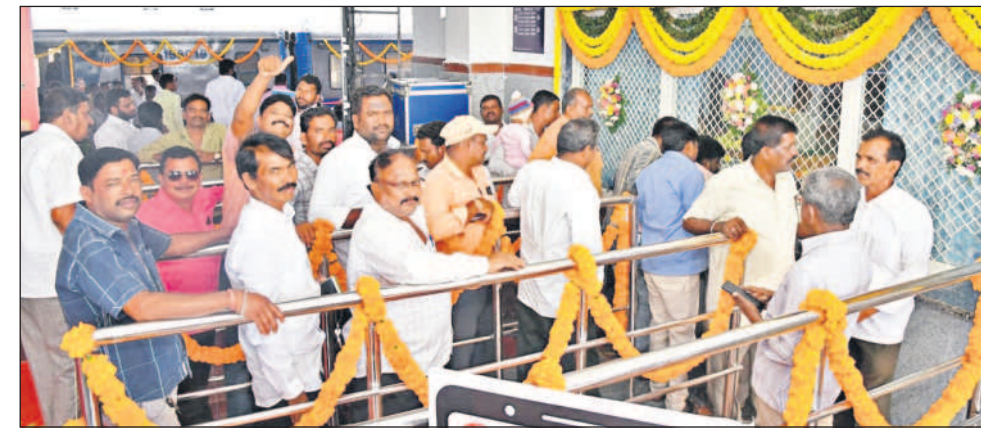
సిద్దిపేటలో రైల్వే కౌంటర్ వద్ద బీకెటి తీసుకుంటున్న ప్రయాణికులు