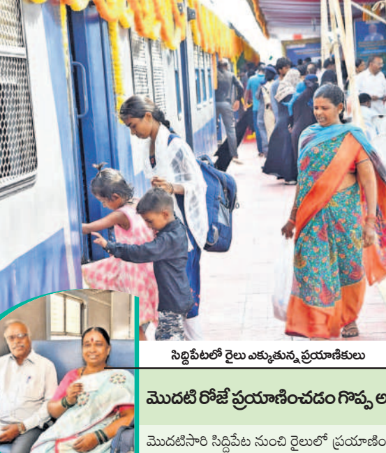
మొదటి రోజే ప్రయాణించడం గొప్ప అనుభూతి మొదటిసారి సిద్దిపేట నుంచి రైలులో ప్రయాణించడం గొప్ప అనుభూతి కలిగింది. హైదరాబాద్ లో ఉన్న మా కుమారుడి