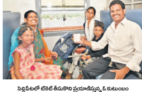
సిద్దిపేటలో బీకెటి తీసుకొని ప్రయాణిస్తున్న ఓ కుటుంబం

సిద్దిపేటకు రైలు రావడం గొప్ప వరం సిద్దిపేట జిల్లాకు రైలు రావడం గొప్ప వరమని మంత్రి తన్నీరు హరీశ్ రావు అన్నారు. నీళ్లు, నిదురు, జిల్లా ఈ కలలను నిజం చేసింది సీఎం కేసీఆర్ మాత్రమేనన్నారు. గత ప్రభుత్వాల తెలంగాణను పట్టించుకోలేదన్నారు. పార్లమెంట్ ఎన్నికలు ఎప్పుడు జరిగినా సిద్దిపేటకు రైలు తెస్తామని ప్రతి ఒక్క పార్టీలు చెప్పాయన్నారు. ఎన్నికలు పూర్తి కాగానే వాటిని మర్చిపోయాయన్నారు. 2006 రైల్వేలైన్ మంజూరైందని.. 33 శాతం రాష్ట్ర వాటా చెల్లించాలని కేంద్రం చెప్పిందన్నారు. సీఎం కేసీఆర్ రైల్వే లైన్ ను స్వయంగా రూపకల్పన చేశారన్నారు. రాష్ట్రంలో ముఖ్యమంత్రులు మారారు