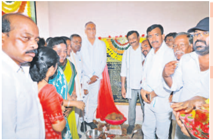
గజ్వేల్ లో అంబేద్కర్ భవనాన్ని ప్రారంభిస్తున్న మంత్రి హరీశ్ రావు

పంటను అమ్ముకునేలా కడపులో పెట్టుకొని చూసుకుంటున్నారన్నారు. కాంగ్రెస్ ప్రభుత్వ ఉన్నప్పుడు రైతుల బతుకులు దుర్భరంగా ఉండేవని, రైతులు కూరగాయలు మూడో పంటగా పెంచుకుంటున్నారన్నారు. దేశంలో 24 గంటల కరింట్ ఇచ్చే దమ్మున్న బీడర్ ఒక్క కేసీఆర్ మాత్రమేనన్నారు. గుంట ఎండకండా పంటలు తీసేలా కరింట్ ఇస్తున్న మహానియుడు కేసీఆర్ అన్నారు. గత కాంగ్రెస్ హయాంలో రైతులు ఎరువుల కోసం చెప్పులు బైన్లో పెట్టి నిలబడితే బస్తా కూడా దొరికేది కాదన్నారు. కానీ కేసీఆర్ ఎరువులు, విత్తనాలు, పెట్టుబడినాయం, పండించిన