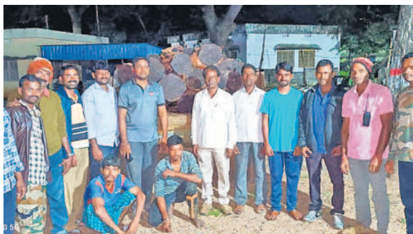
పట్టుకున్న కలప, నిందితులను చూపుతున్న ఫారెన్సిక్ అధికారులు