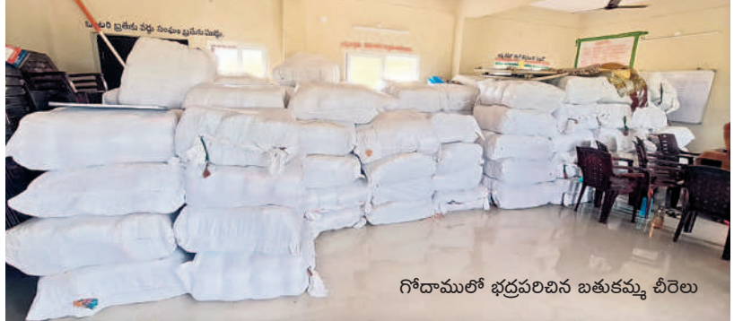
గోదామూరి భద్రవారిని బతుకమ్మ చీరలు

మహబూబాబాద్, అక్టోబర్ 3(నమస్తే తెలంగాణ): ఏటా బతుకమ్మ పండుగ సందర్భంగా రాష్ట్ర సర్కారు ఆడబిడ్డలకు కానుకగా సారే అందిస్తున్నది. అన్ని మతాల పండుగలను సమానంగా చూస్తున్న ప్రభుత్వం రంజాన్ పండుగకు ముస్లింలకు, క్రీస్తుని పండుగకు క్రీస్తులకు గిట్టెప్యాక్టులు, బతుకమ్మ పండుగకు తెలంగాణ ఆడబిడ్డలకు బతుకమ్మ చీరలను పంపిణీ చేస్తూ ప్రజల సంస్కృతీ సంప్రదాయాలను గౌరవిస్తున్నది. ఈ సారే 10 రంగులు, 195 డిజైన్లలో నాణ్యతతో తయారు చేసిన చీరలను బుధవారం నుంచి పంపిణీ చేసేందుకు అధికార యంత్రాంగం ఏర్పాట్లు పూర్తి చేసింది. ప్రభుత్వం నుంచి వచ్చిన చీరలను వెంటనే వివిధ మండలాలకు కేటాయిస్తున్నారు. జిల్లాలో 2,64,240 మంది ఆడబిడ్డలకు బతుకమ్మ చీరలు పంపిణీ చేయాలని అధికారులు నిర్ణయించారు. జిల్లాలో 2,64,240 మంది మహిళలను అర్హులుగా గుర్తించగా, వారందరికీ పంపిణీ చేసేలా జిల్లా చీరలు చేరాయి. వచ్చిన చీరలను తొర్రూరు, మరపెడ, కురవి, గూడూరు, డోర్నకల్ తదితర మండలాల్లో భద్రపరిచారు. 18 ఏళ్లు నిండిన ఆడబిడ్డలకు అందజేయను