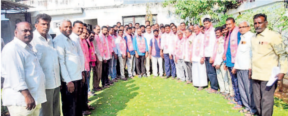
మంత్రి ఎర్రబెల్లి సమక్షంలో బీఆర్ఎస్ లో చేరిన కొలుకొండ కాంగ్రెస్, టీడీపీ శ్రేణులు

దేవరుప్పల, అక్టోబర్ 3: దేవరుప్పల.. బీఆర్ఎస్ పార్టీకి కంచుకోటగా ఉన్నదని, మండలంలో జరిగిన అభివృద్ధి ఇందుకు కారణమని రాష్ట్ర పంచాయతీరాజ్ శాఖ మంత్రి ఎర్రబెల్లి దయాకర్ రావు అన్నారు. మంగళవారం హైదరాబాద్ బంజరాహిల్స్ లోని మంత్రి నివాసంలో కాంగ్రెస్, టీడీపీల నుంచి బీసీ నాయకులు, కార్యకర్తలు భారీగా బీఆర్ఎస్ లో చేరారు. వారికి మంత్రి దయాకర్ రావు కండువా కప్పి పార్టీ లోకి ఆహ్వానించారు. ఈ సందర్భంగా మంత్రి దయాకర్ రావు మాట్లాడుతూ.. తనపై నమ్మకముంచి వివిధ పార్టీల నుంచి బీ ఆర్ఎస్ లో చేరిన శ్రేణులకు తగిన ప్రాధాన్యత ఉంటుందని తెలిపారు. దేవరుప్పల వాగుపై చెక్ డ్యాం నిర్మాణంతో భూగర్భ జలాలు పెరిగి నీటి ఊటలు వస్తున్నాయన్నారు. అత్యధికంగా డబుల్ బెడ్రూంల నిర్మాణం జరిగిందని, సంక్షేమ పథకాలు పార్టీలకతీతంగా ఇంటింటికీ అందాయని మంత్రి తెలిపారు. తనకు అన్ని విధాలా సహకరిస్తున్న దేవరుప్పల మండలాన్ని అభివృద్ధిలో ముందు వరుసలో ఉంచుతానని అన్నారు. కొలుకొండ గ్రామం నుంచి మూడు రోజుల్లో భారీ చేరికలు జరిగాయని, తనపై నమ్మకంతో వివిధ పార్టీల నుంచి వస్తున్న వారికి పథకాల్లో ప్రాధాన్యం ఇవ్వాలన్నారు.