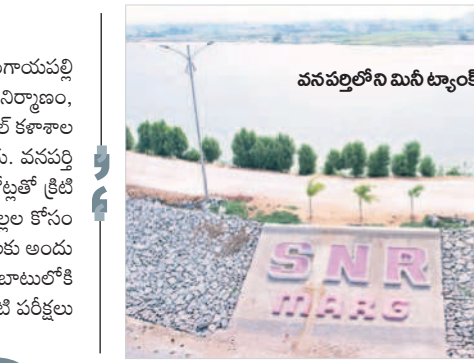
వనపర్తిలోని మినీ ట్యాంక్ బండ్

రోడ్ల విస్తరణను మంత్రి నిరంజన్ రెడ్డి చొరవతో రూ.49.50కోట్లతో శరవేగంగా పనులు చేపడుతున్నారు. అలాగే వనపర్తి వెళ్ళే రోడ్లను మరీచిలం వద్ద ఏర్పాటు చేసి బైపాస్ రోడ్లతో వనపర్తి జిల్లా కేంద్రం రూపురేఖలో మారనున్నాయి.