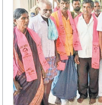
బీఆర్ఎస్ లో చేరిన జూపల్లి వర్గీయులతో ఎమ్మెల్యే బీరం హర్షణ్ రెడ్డి

కోల్కాపూర్, అక్టోబర్ 3 : కోల్కాపూర్ ఎమ్మెల్యే బీరం హర్షణ్ రెడ్డి ఆధ్వర్యంలో బీఆర్ఎస్ లోకి మహిళా జూపల్లి వర్గీయులు చరుగు క్యూట్టారు. మంగళవారం కోల్కాపూర్, పెద్దకొత్తపల్లి మండలాలకు చెందిన జూపల్లి వర్గీయులు సుమారు 220 మంది కార్యకర్తలను హస్తం పాక్షిని వీడి కార్యకర్తలు. పెద్దకొత్తపల్లి మండలం బాచారంలో 150 మంది బీఆర్ఎస్ లో చేరారు. మరెక్కడైనా మందిని గ్రామానికి చెందిన బీఆర్ఎస్ కార్యకర్తలు ఐదు రోజుల కిందట కాంగ్రెస్ లోకి వెళ్లి, తిరిగి 50 మంది తాజాగా బీఆర్ఎస్ లో ఎమ్మెల్యే సమక్షంలో సాతాపూర్ లో చేరారు. కోల్కాపూర్ మండలం మందలపరావుపేట, మాచిసేపల్లి గ్రామానికి చెందిన జూపల్లి వర్గీయులు 20 మంది మహిళా కార్యకర్తలతో కలిసి 20 మంది వర్గీయులను హస్తం పాక్షిని వీడి ఎమ్మెల్యే బీరం హర్షణ్ రెడ్డి లోకి చేరారు.