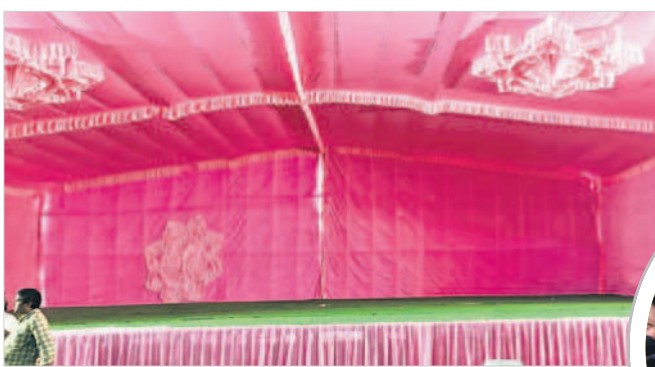
మక్తల్ లో ఏర్పాటు చేసిన సభాస్థలి

మహబూబ్ నగర్, అక్టోబర్ 3 (సమస్త తెలంగాణ ప్రతినిధి) : గతంలో దవాఖానలకు బోవాలంటే.. నేను రాను బిడ్డ.. సర్కారు దవాఖానకు అన్న కోణాలు ఉండేవి. ప్రైవేటు దవాఖానలకు వెళ్లాలంటే జీవలు గర్భ అయ్యేవి. కానీ తెలంగాణ ఏర్పడిన తర్వాత సీఎం కేసీఆర్ హయాంలో వైద్యరంగం ఎంతో అభివృద్ధి చెందింది. దీంతో ఆహా! నానుడి కనుమరుగైపోయింది. నూతన భవనాలు, దవాఖానల స్థాయి పెంపు, వసతులు, 24 గంటలు అందుబాటులో వైద్యులు, సిబ్బంది ఉండేలా చర్యలు తీసుకున్నారు. గ్రామీణ ప్రాంతాల్లో వైద్య సేవలను విస్తరించేందుకు ప్రభుత్వం పల్లెదవాఖానలు, పట్టణాల్లో బస్ దవాఖానలు తెరిచాయి. అంతే గాక ప్రతి మండల కేంద్రంలో కనీసం 30 పడకల స్థాయిలో వసతులు కల్పించారు. దీంతో ప్రభుత్వ వైద్య సేవలపై భరోసా పెరిగి దవాఖానలకు క్యూ కడుతున్నారు. గతంలో ఉమ్మడి జిల్లాలో మినీ రెసీపిట్లు ఉండే దవాఖానలను ఇప్పుడు ప్రజలకు అవసరమన్న చోట నిర్వహిస్తున్నారు. ప్రభుత్వ సహకారంతో పేదలకు వైద్య, ఆరోగ్యశాల మంత్రి హరీశ్ రావు అత్యుబంధంగా చూడారు. ఉమ్మడి జిల్లాలో పెద్దానుపత్రులు, డివజన్ కేంద్రాల్లో, నియోజకవర్గ కేంద్రాల్లో ఏరియా దవాఖానలు ఉన్నా సౌలభ్యం అంతంత మాత్రమే.. కానీ తెలంగాణ ఏర్పడ్డక దవాఖానల రూపురేఖలు మారిపోయాయి. కార్పొరేట్ స్థాయిలో దవాఖానలను నిర్వహిస్తున్నది. అడిగిన వెంటనే దవాఖానలు మంజూరు చేస్తూ పల్లెల్లో వైద్య సేవలను అందించాలనే లక్ష్యంతో మంత్రి హరీశ్ రావు పనిచేస్తున్నారు. భవిష్యత్లో ఉమ్మడి జిల్లాలో దవాఖానలు లేని మండలమే కనిపించక మానదు. కొత్త జిల్లాలను ఏర్పాటు చేసి జిల్లాకో మెడికల్ కాలేజీ ఇచ్చి దానికి అనుబంధంగా కార్పొరేట్ స్థాయిలో పెద్ద దవాఖానలు నిర్వహిస్తారు. భవిష్యత్లో ఉమ్మడి జిల్లాలో ప్రైవేటు వైద్యశాలలు మూతపడదు ఖాయంగా కనిపిస్తుంది.