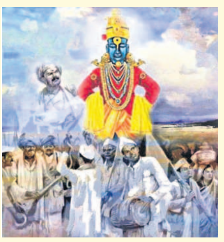
వార్ కరీ యాత్ర జరిగినన్ని రోజులూ భక్తులు ప్రత్యేక వస్త్రాలను ధరించి, అత్యంత నియమనిష్ఠలతో గడుపుతారు.

మరాఠీలో వారి అంటే తీర్థయాత్ర. కరి అంటే చేసేవాడు. వార్ కరీలు ప్రతీ ఏడాది రెండుసార్లు- ఆషాఢ, కార్తిక మాసాల్లో శుద్ధ ఏకాదశి నాటికి మహారాష్ట్రలోని ప్రసిద్ధ పుణ్యక్షేత్రం పండరీపురానికి ఒక యాత్రగా చేరుకుంటారు. పండరీపురంలో ప్రధానదైవం పాండరంగ విగ్రహం. దీనిని క్రీ.శ. 13వ శతాబ్దానికి చెందిన మహారాష్ట్ర భక్తి ఉద్యమకారుడు జ్ఞానేశ్వర్ ప్రారంభించాడని అంటారు. పండరీపురం మహారాష్ట్ర భక్తి ఉద్యమ కేంద్రం. వార్ కరీ యాత్రకు ఒక నెల ముందునుంచే పాండరంగ విగ్రహాన్ని ప్రసిద్ధ భక్తులైన జ్ఞానేశ్వర్ (అలంక నుంచి), తుకారాం (దేహూ నుంచి), నివృత్తినాథుడు (త్రయంబకం నుంచి), ఏకనాథ్ (ఫైరత్ నుంచి) తదితరుల పాదుకలు ఉంచిన పల్లకీలను పండరీపురానికి తీసుకువస్తారు. ఈ పల్లకీలను డిండిలని పిలుస్తారు. ఇలా వచ్చేటప్పుడు ఆయా భక్తులు రాసిన అభంగాలు, భజనకీర్తనలను ఆలపిస్తూ పండరీపురానికి పాదయాత్ర చేస్తారు.