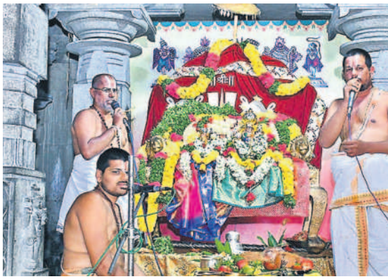
స్వామి, అమ్మవార్ల నిత్య తిరుకల్యాణోత్సవం నిర్వహిస్తున్న అర్చకులు

యాదగిరిగుట్ట, అక్టోబర్ 3 : యాదగిరిగుట్ట దివ్యక్షేత్రంలో లక్ష్మీనారసింహుడి నిత్యార్చనలు అత్యంత వైభవంగా సాగాయి. సుప్రభాతం నుంచి పవళింపు సేవ వరకు స్వామి, అమ్మవార్ల నిత్య కైంకర్యాలు పాంచరాత్రాగమశాస్త్రం ప్రకారం జరిగాయి. మంగళవారం తెల్లవారుజామున స్వామివారికి సుప్రభాత సేవ నిర్వహించారు. తిరువారాధన నిర్వహించి ఉడయం ఆరగింపు చేపట్టారు. స్వామివారికి నిజాభిషేకం, తులసి సహస్రనామార్చన, అమ్మవారికి కుంకుమార్చన, ఆంజనేయస్వామికి సహస్రనామార్చన చేపట్టారు.