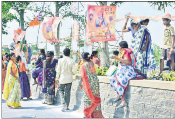
మోదీ సభకు వెళ్లకుండా నగరంలో సీడ తీరుతున్న మహిళలు

బోధన్/కమ్మరపల్లి, అక్టోబర్ 3: నిజామాబాద్ జిల్లాలో ప్రధానమంత్రి సరేంద్రమోదీ పర్యటన ఊరించి ఉసురుమన్నట్టు సాగింది. మోదీపై ప్రజలు పెట్టుకున్న ఆశలు గల్లంతుయ్యాయి. ప్రధాని హోదాలో రెండోసారి ఇందూరుకు వచ్చిన మోదీ జిల్లా వరాలు కురిపిస్తారని అంతా భావించారు. దశాబ్దాల కల అయిన బోధన్-బీదర్ రైల్వే లైన్ కు పచ్చజెండా ఊపుతారని ఆశించారు. అలాగే, పసుపుబోర్డు నిజామాబాద్ లోనే ఏర్పాటు, విభిధానాల ప్రకటన ఉంటుందని రైతులు భావించారు. కానీ ప్రజల ఆకాంక్షలు పట్టించుకోని ప్రధాని నిధుల మూటలు ఇవ్వకుండా మాటలు చెప్పి వెళ్లిపోవడంతో జనం అవాక్కయ్యారు. ఇందూరుకు వచ్చిన సరేంద్ర మోదీ.. పలు ప్రాజెక్టులను జాతికి అంకితం చేశారు. రూ.6 వేల కోట్లతో నిర్మించిన ఎన్టీపీసీ తెలంగాణ సూపర్ పవర్ ధర్మల్ పవర్ ప్రాజెక్టును, రూ.1200 కోట్లతో 76 కిలోమీటర్ల మేర నిర్మించిన సిద్దిపేట్-మనోహరాబాద్ కొత్త రైల్వేలైన్ ను, రూ.305 కోట్లతో ధర్మాబాద్-మనోహరాబాద్-మహబూబ్ నగర్-కర్నూల్ రైల్వేమార్గంలో జరిగిన విద్యుద్దీకరణ లైన్, సిద్దిపేట్-సికింద్రాబాద్ రైలును ఆయన ప్రారంభించారు. తెలంగాణలో 20 క్రిటికల్ కేర్ బ్లాక్స్ కు శంకుస్థాపన చేశారు. బహిరంగసభ ప్రాంగణంలో ప్రత్యేకంగా ఏర్పాటుచేసిన వేదికపై నుంచి అభివృద్ధి కార్యక్రమాలను వర్చువల్ లో ప్రారంభించిన మోదీ.. ఆనంతరం బహిరంగసభ వేదికపైకి వచ్చి ప్రజలను ఉద్దేశించి ప్రసంగించారు.