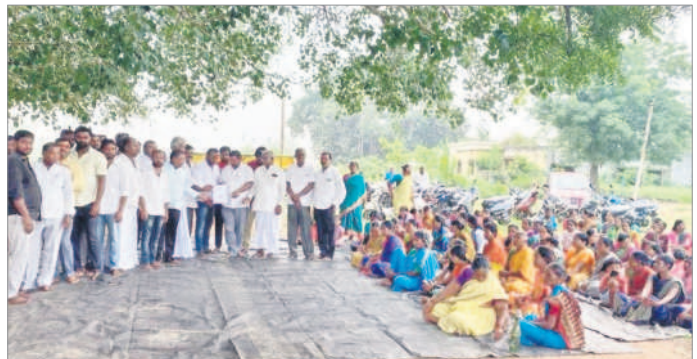
ఆర్కూర్ మండలం రాంపూర్ గ్రామస్థల ఏకగ్రీవ తీర్మానం