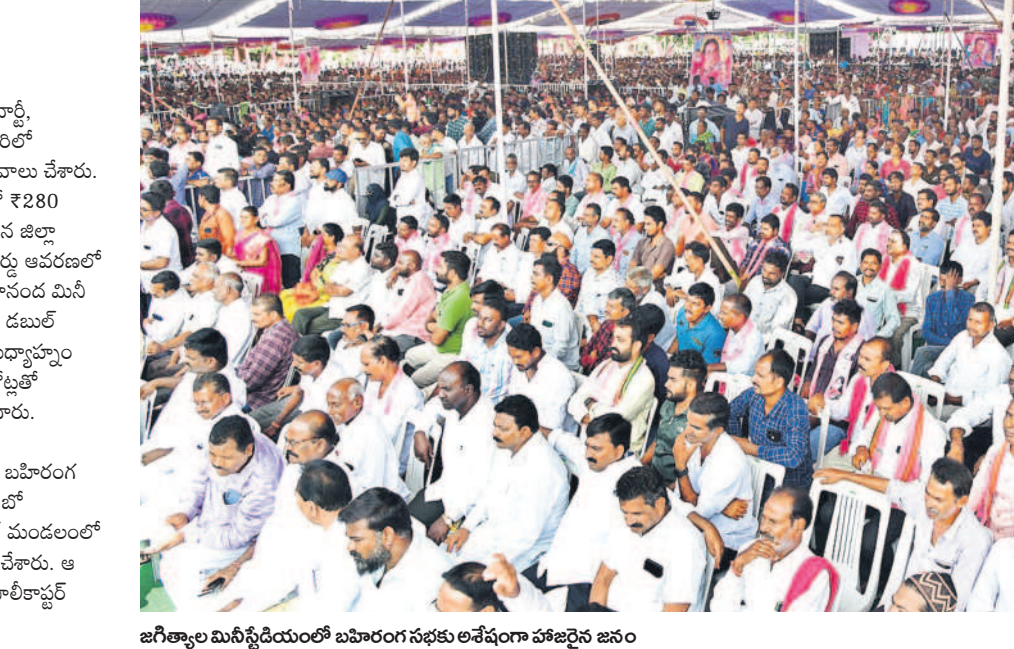
జగిత్యాల మినీ స్టేడియంలో బహిరంగ సభకు అనేకంగా హాజరైన జనం