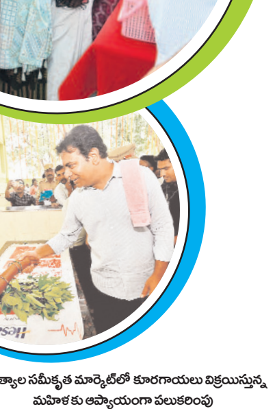
జగిత్యాల సమీకృత మార్కెట్లో కూరగాయలు విక్రయిస్తున్న మహిళా కుటుంబసభ్యులు