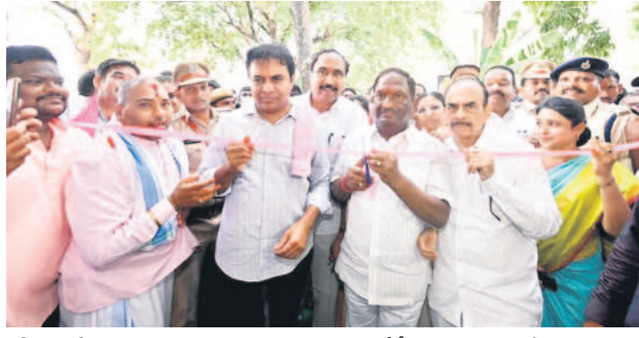
జగిత్యాలలో సమీకృత మార్కెట్ను ప్రారంభిస్తున్న మంత్రులు కేటీఆర్, మహమూద్ అలీ, కొప్పల ఈశ్వర్