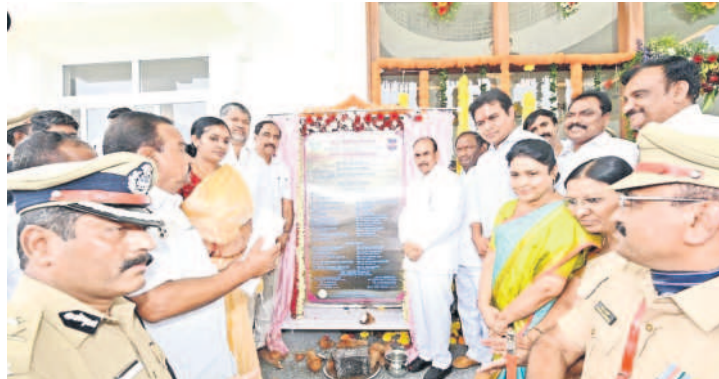
జగిత్యాలలో పోలీస్ ప్రధాన కార్యాలయ శిలాఫలకాన్ని ఆవిష్కరిస్తున్న మంత్రులు, ఎమ్మెల్యేలు