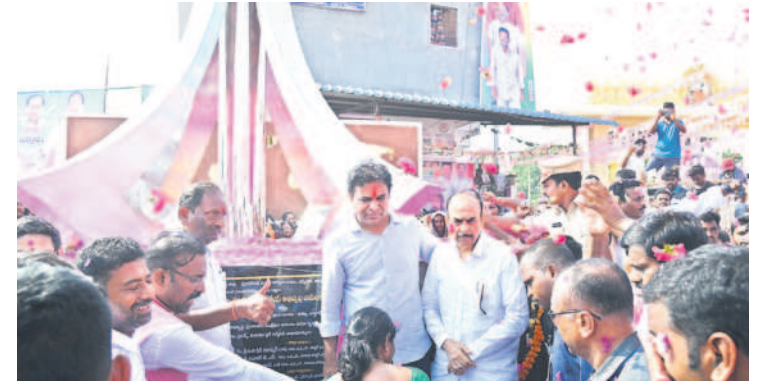
ధర్మపురి: పైసాన్స్ ని ఆవిష్కరిస్తున్న మంత్రులు కేటీఆర్, మహమూద్ అలీ, కొప్పల ఈశ్వర్