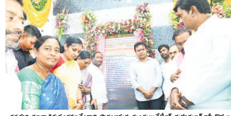
ధర్మపురి: మాతాశిశు సంరక్షణ కేంద్రాన్ని ప్రారంభిస్తున్న మంత్రులు కేటీఆర్, మహమూద్ అలీ, కొప్పల ఈశ్వర్, చిత్రంట్ల ఐవీ బాల్య సుమన, ఎంపీ బోధకుల వెంకటేశ్ నేతకాని