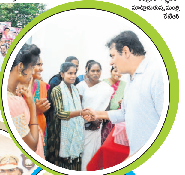
ధర్మపురి మాతాశిశు సంరక్షణ కేంద్రంలో గొల్లెటిలో మాట్లాడుతున్న మంత్రి కేటీఆర్