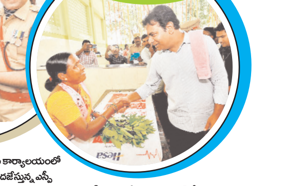
జగిత్యాల సమీకృత మార్కెట్లో కూరగాయలు విక్రయిస్తున్న మహిళలకు ఆప్యాయంగా పలుకరింపు