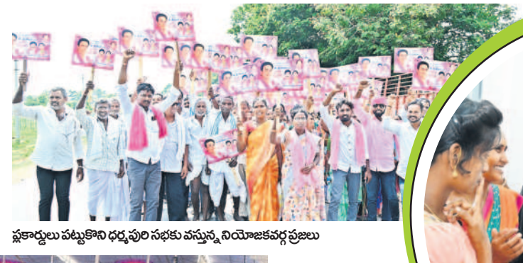
ష్కార్లు పట్టుకొని ధర్మపురి సభకు వచ్చిన నియోజకవర్గాల ప్రజలు