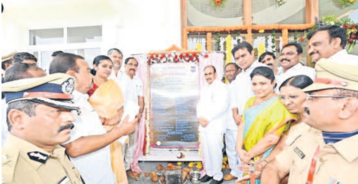
జగిత్యాలలో పోలీస్ ప్రధాన కార్యాలయ శిలాఫలకాన్ని ఆవిష్కరిస్తున్న మంత్రులు, ఎమ్మెల్యేలు