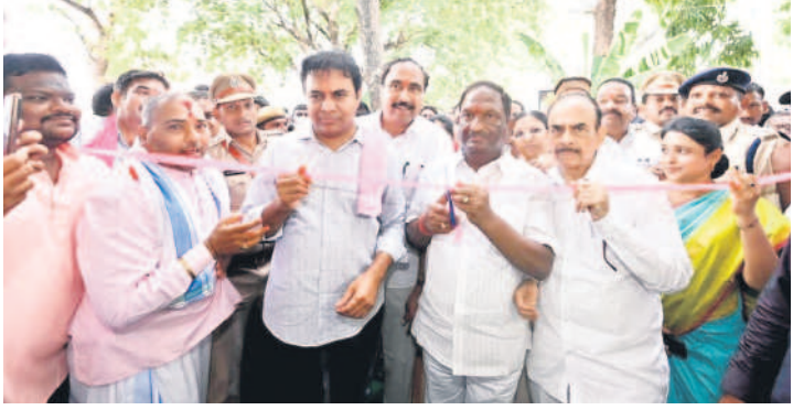
జగిత్యాలలో సమీకృత మార్కెట్ను ప్రారంభిస్తున్న మంత్రులు కేటీఆర్, మహమూద్ అలీ, కొప్పల ఈశ్వర్